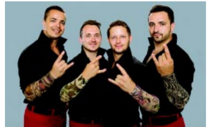
4 for Dance

testáns iskolatörténeti mozaik kiállítás , az Evangélikus Kossuth Lajos Gimnázium és a Református Tehetséggondozó Alapítvány közös szervezésében.