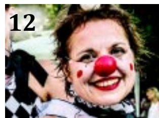
BÚCSÚ A VIDORTÓL