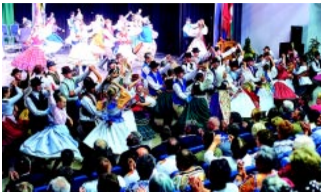
A Nyírség Nemzetközi Néptáncfesztivál fellépői az ünnepen is nagy sikert arattak