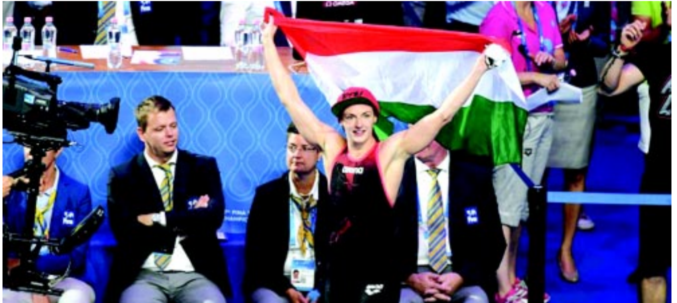
Hosszú Katinka volt szokás szerint a csúcs, de a teljes magyar csapatot óriási szeretettel vette körül a közönség

– Igen, s ezek közül leginkább a francia sportminiszter-