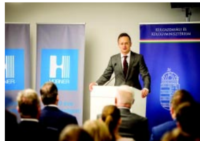
Sziijártó Péter külgazdasági és külügyminiszter jelentette be Budapesten a kormányzati támogatást, mely nagyban segíti a Hübner munkahelyteremtő bővülését

(Szerző: Bruszel Dóra) (Folytatás az 5. oldalon.)