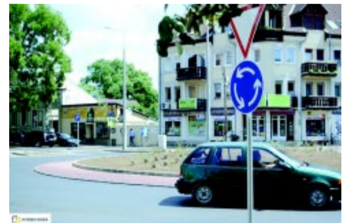
A víztorony környékén több fejlesztés is történt: a körforgalom kialakítása mellett megújult a Kígyó utca is, amely új csomópontot kapott