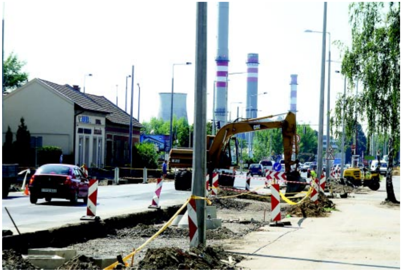
Egyre látványosabb a beavatkozás a Mező, a Bethlen Gábor és a Vasgyár utca csomópontjában, a beruházás befejezését legkésőbb év végére ígérik

ni a gépjárművek, hogy minél kevesebbet használják a lakott részeket. Ezzel párhuzamosan pedig felújítjuk a Szélsőbokori utat és a Legyező utcát is, így a Kertváros valóban sokat lép előre a koncepciónk alapján – fogalmazott kérdésünkre a polgármester.