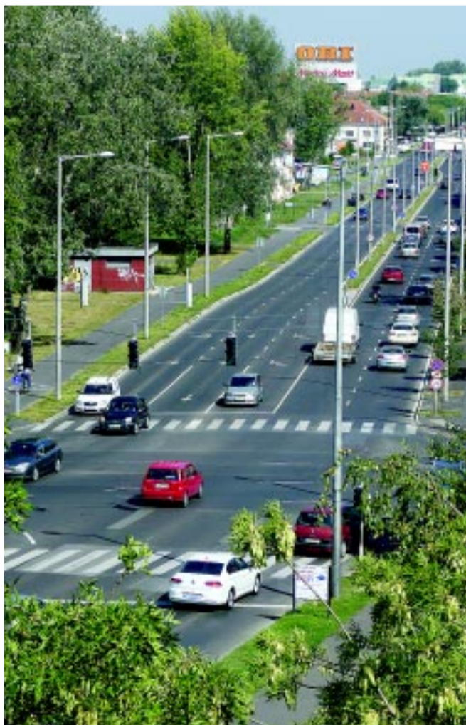
Gyorsan megszoktuk a jót: a Szegefű utca már hónapok óta négysávos, így megszűnt a belvárosi szűkület

S persze, a korábban megjelenteknek megfelelően messze nem ez lesz az egyetlen fejlesztés a kertvárosi részen. A Nyugati elkerülőnek attól az elágazásától, ahol a LEGO déli bejárata, az árufeltöltés található, az ipartelep felé épül egy út, ami tulajdonképpen a régi, részben földútként használt úgynevezett Rókabokori út, amely teljes hosszában új aszfaltburkolatot kap, s melyet stratégiai fejlesztésnek tekint a városvezetés. Ehhez kapcsolódva a Bottyán utcát is felújítják, így éri el majd „hátról”, a Michelin irányában a jelentős gyárakat. – A cél az, hogy az ottani, számos prosperáló nagyvállalattal teli ipartelepét úgy tudják megközelí-