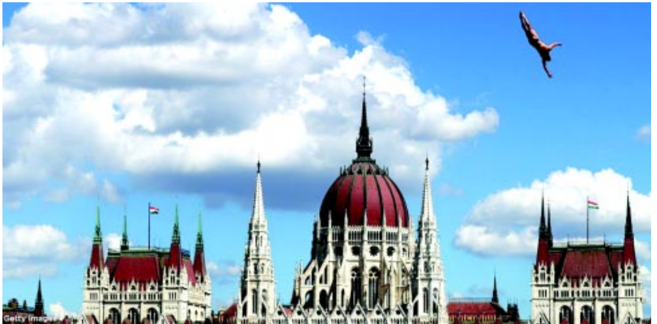
A helyszínek szintén elvarázsolták a külföldi nézőket is, ami igazi marketinget jelentett hazánkban

– A hétéves ikreimet épp most tanítom úszni, figyelek rájuk, hogy már fiatal korban minél jobb legyen a techni-