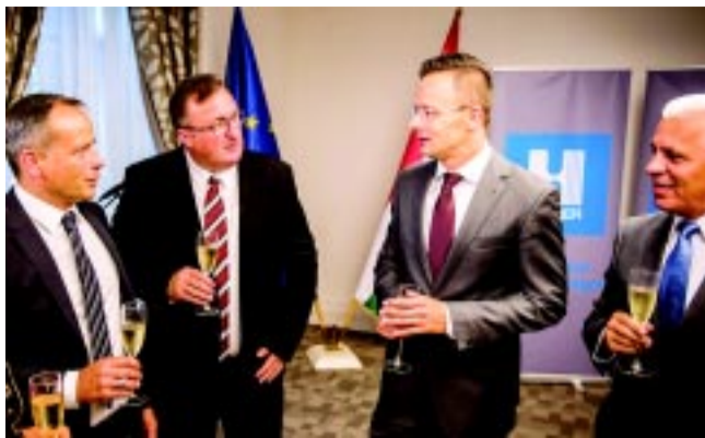
Dr. Kovács Ferenc polgármester az ünnepélyes bejelentésen koccintott magyar szokás szerint Szijjártó Péter külgazdasági és külügyminiszter (jobbról a második), illetve Ingo Heerdt, a Hübner-H Kft. ügyvezetője (bal szélén) társaságában a fejlesztésre

Szijjártó Péter külgazdasági és külügyminiszter a vállalat beruházási támogatásának bejelentésén hangsúlyozta, a 2015. és a 2016. magyar beruházási rekordéveket követően az idei esztendő első félévi adatai alapján reális az esély arra, hogy Magyarországon 2017-ben újabb csúcsot érjenek el az itteni beruházások. Az idén az első félévben 47 új magyarországi befektetésről állapodtak meg a Nemzeti Befektetési Ügynökség (HIPA) közreműködésével a tavalyi egész évi, rekordot jelentő 71 projekttel szemben. A magyar gazdaság versenyképességét pedig tökéletesen példázza, hogy a világ számos országában jelentős gyár-