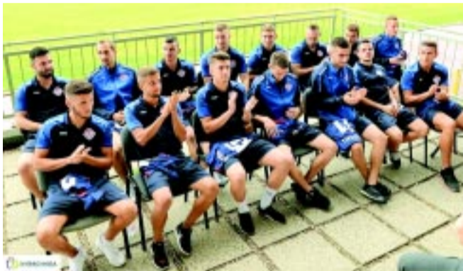
Egyelőre a csapat tapsolt a közönségnek – nemsokára fordítva lehet

– A cél az, hogy öt év alatt egy stabil NB I-es csapat legyen Nyíregyházán, és nem titkoltan van egy olyan álmunk, hogy az új stadionunkban telt házas UEFA Európa-liga mérkőzést vívjunk. Rengeteg feladat vár még ránk, de a csapat filozófiája nem változhat: első a klub és a címer, második a csapat, a harmadik az egyén. Ezt mindig szem előtt kell tartanunk – mondta a Szpari sportszakmai ügyvezetője.