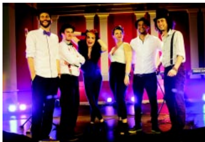
Electric Swing Circus

(Jövő heti számunkban még visszatérünk a témára a lapunk megjelenése napján, pénteken tartott sajtótájékoztató kapcsán.)