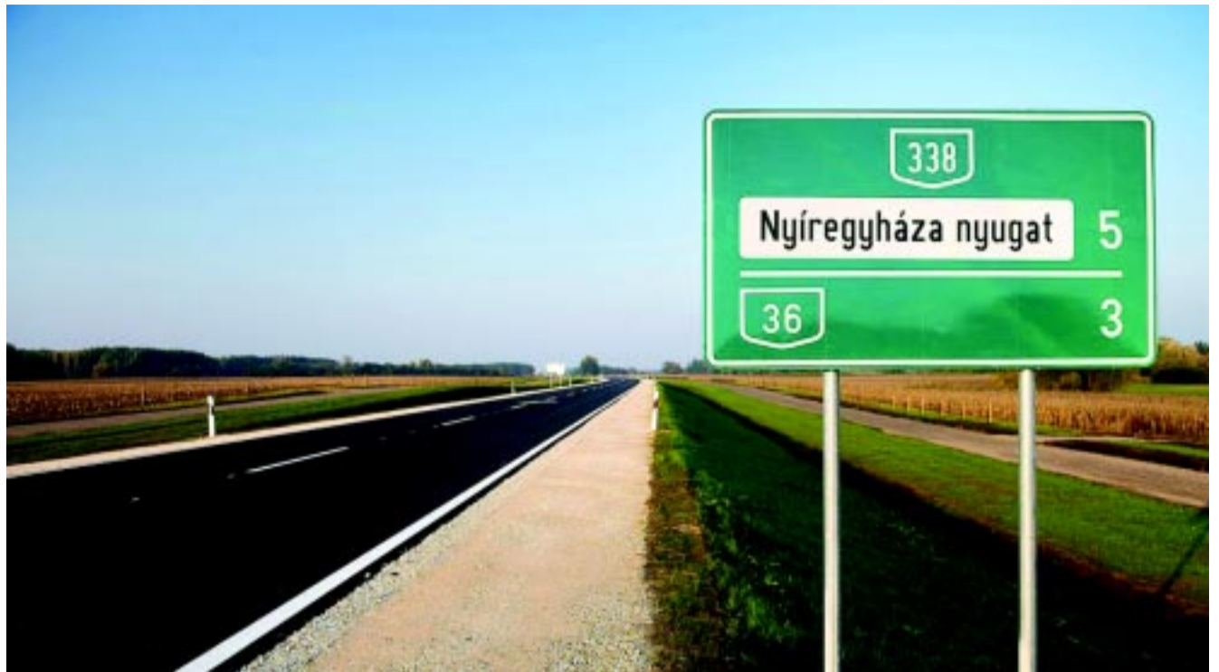
A Nyíregyházát nyugatról elkerülő 338-as főút második, újonnan átadott szakasza

Az M3-as további kiegészítő szakaszai így jönnek létre: az autópálya a román határt a Debrecen irányában kivite-