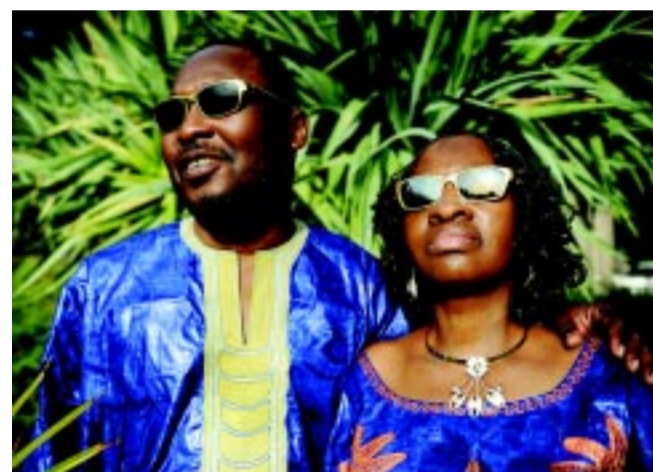
Amadou & Mariam