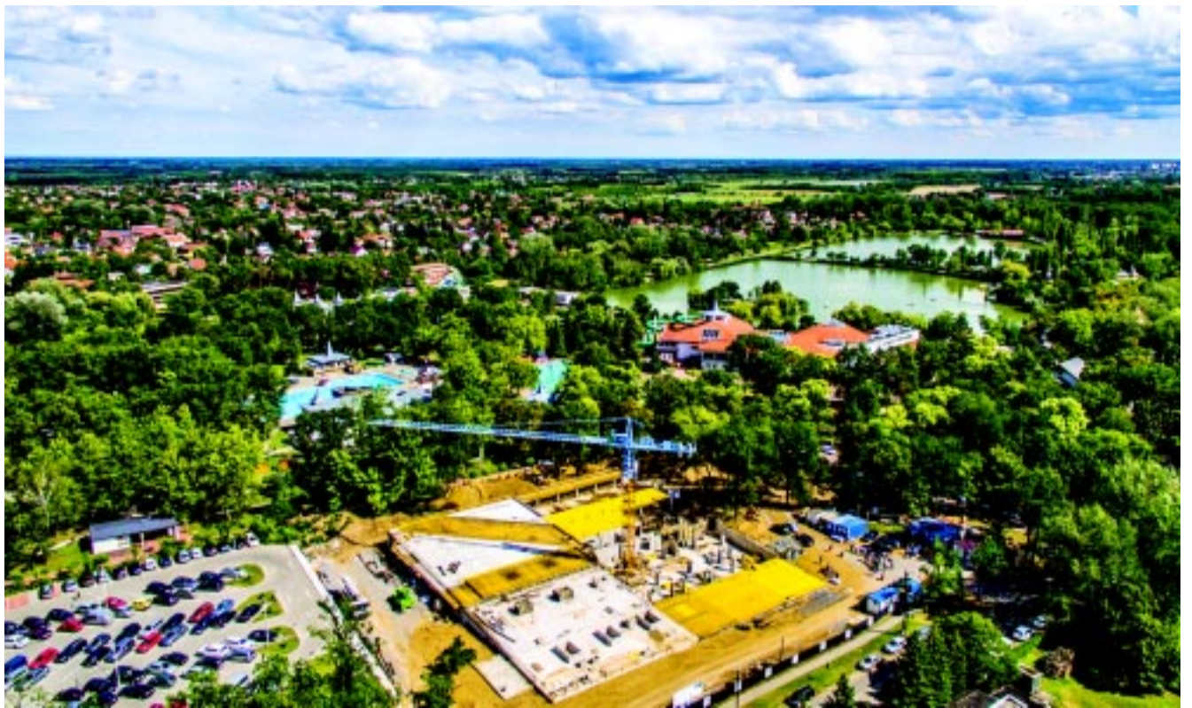
Az épülő hotel madártávlatból, sóstói „díszletek” között

Wellness- és konferenciahotel, 122 szoba, közel 150 fős étterem terasszal, látványbár, 90 férőhelyes mélyga-