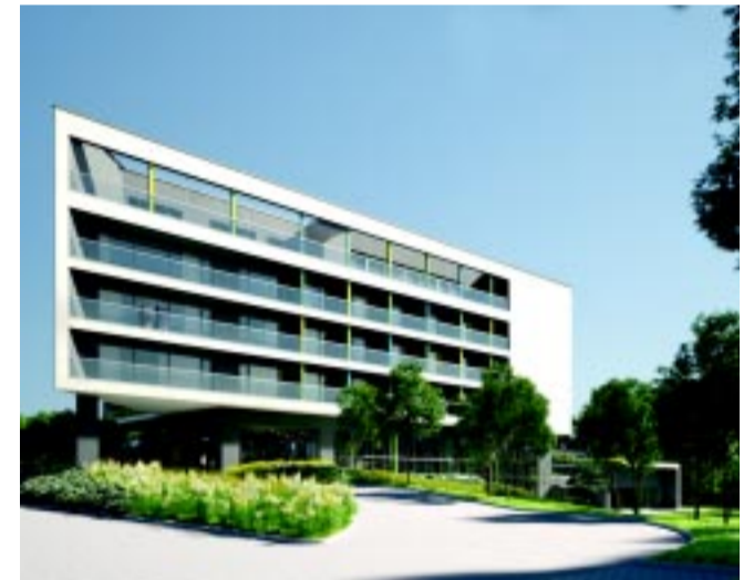
Az új hotel látványtervének egyik nézőpontja

– A beruházással 66 új munkahely jön létre – tette hozzá a polgármester. Dr. Kovács Ferenc hangsúlyoz-