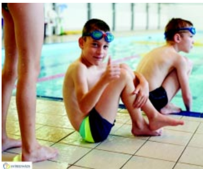
Önkormányzati úszótábor az Aranyban