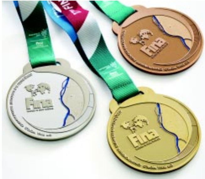
A világbajnokság érmei