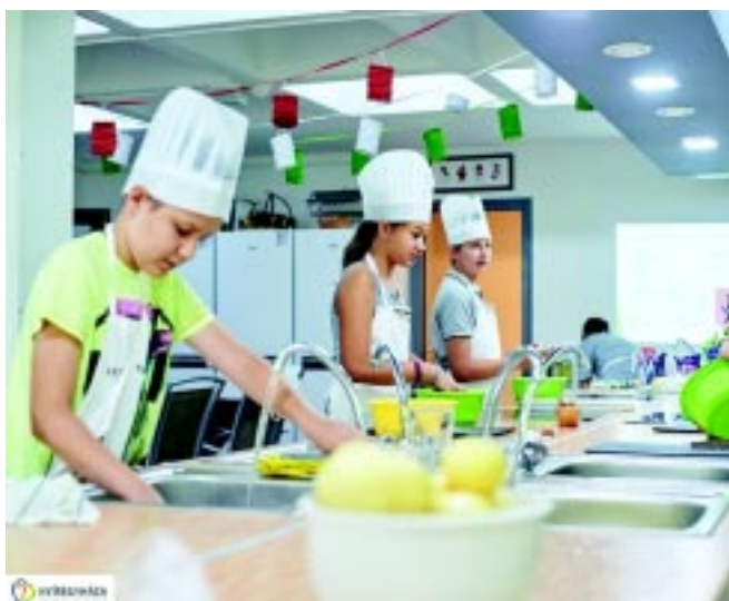
Séttábor a belvárosban

Így van ez Nyíregyházán is, ahol például az önkormányzat támogatásával hét napközis tábor típusba és a szigligeti táborba várják a gyerekeket. Képriportunk segítségével ezekbe is bepillanthatnak.