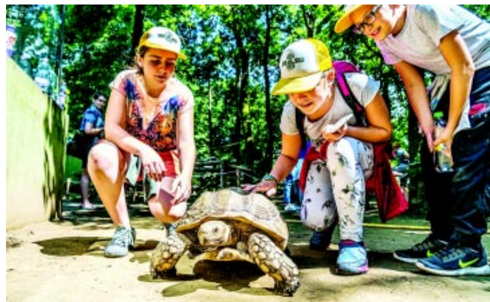
ZOO Suli az állatparkban