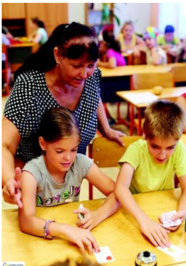
Önkormányzati nyelvi tábor a szőlőskerti tagintézményben