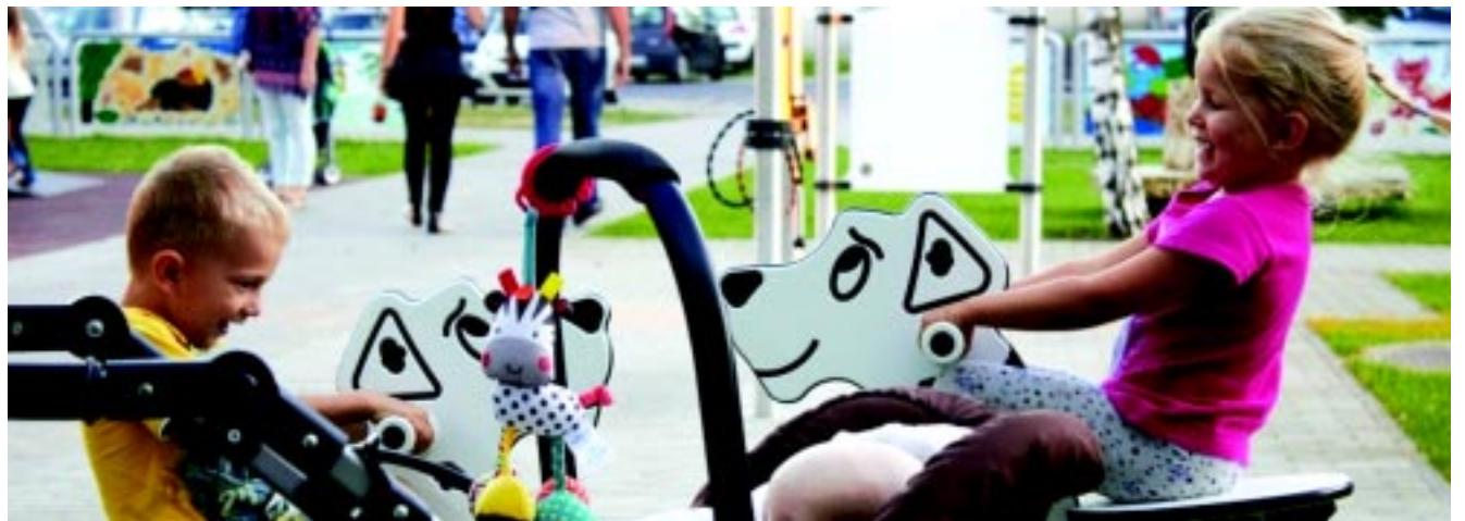
Népszerű az integrált játszótér is

– Egy olyan falat szeretnék létrehozni az integrált játszótér részeként, városunk vezetésének egyetértésével, amelyen a szellemi, fogyatékos, vak vagy gyengén látó gyerekek és akár kamaszok vagy felnőttek anatómiai módon,