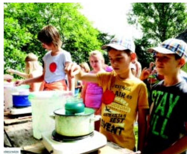
Önkormányzati tábor a múzeumfaluban