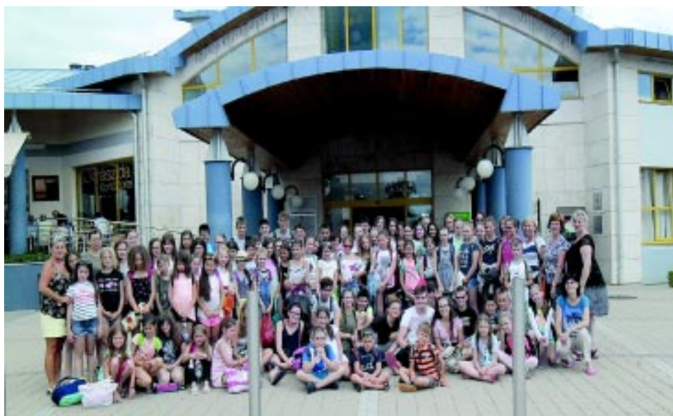
Önkormányzati Szigligeti tábor a Balatonnál