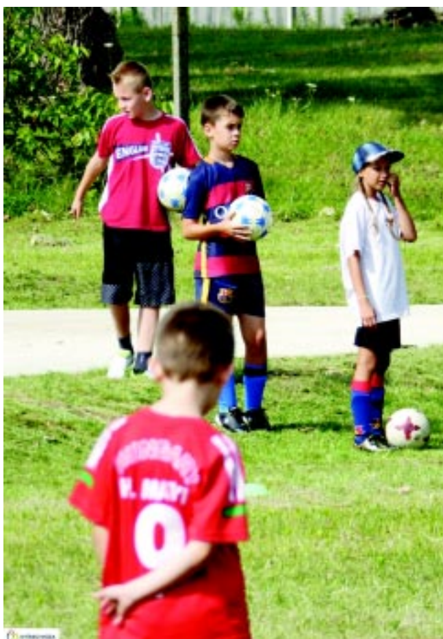
Önkormányzati focitábor Nyírszőlősen