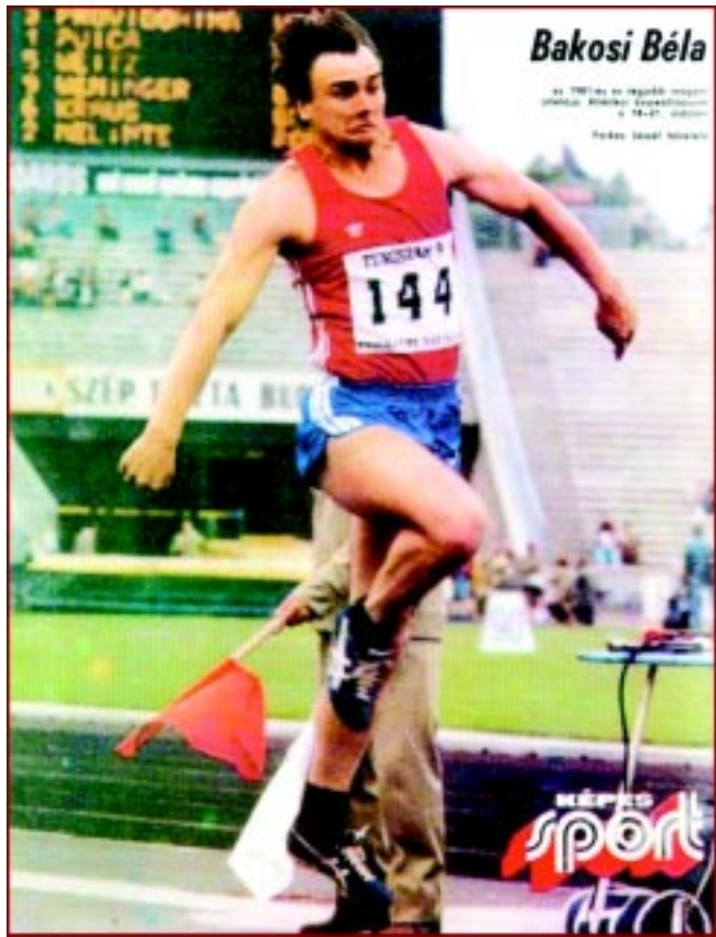
1981 Az év atlétája