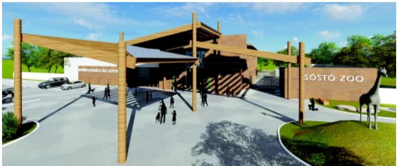
Várhatóan jövőre ez a kép fogadja az állatparkhoz érkezőket

– A Pangea egy egyedi, különleges hotel lesz a tőparton, az állatpark területén, de már másfél hónapja