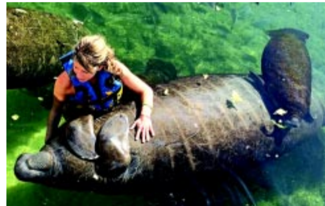
Tengeri tehenekkel Mexikóban

lakosság nagy része ugyanis még a mai napig hisz az albínó testrészek varázserejében. Az áldozatoknak például hatalmas biztonságérzetet jelent, hogy tudnak róluk a világban. A média hangot ad a rémisztő helyzetüknek, felhívja a figyelmet a kegyetlen és véres történetekre, ezzel