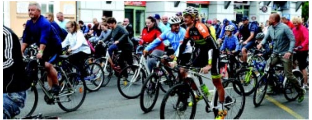
Népszerű volt a Vidám Kerekezés

Hetedik alkalommal rendezték meg a Michelin Bringafesztivált Nyíregyházán. Ezúttal is számos programmal várták a családokat a szervezők. A hangsúly a közlekedésbiztonságon volt.