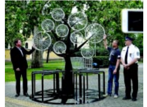
A „Kerékpárfát” a bringafesztiválon adta át az alpolgármester és a gyárigazgató

– Szerettünk volna a városnak valami maradandó emléket is hagyni a bringafesztivál után, nem csak a napnak az élményét. Ez könnyebbé teszi a városban való kerékpározást, hiszen lehet hol parkolni. A 16 ál-