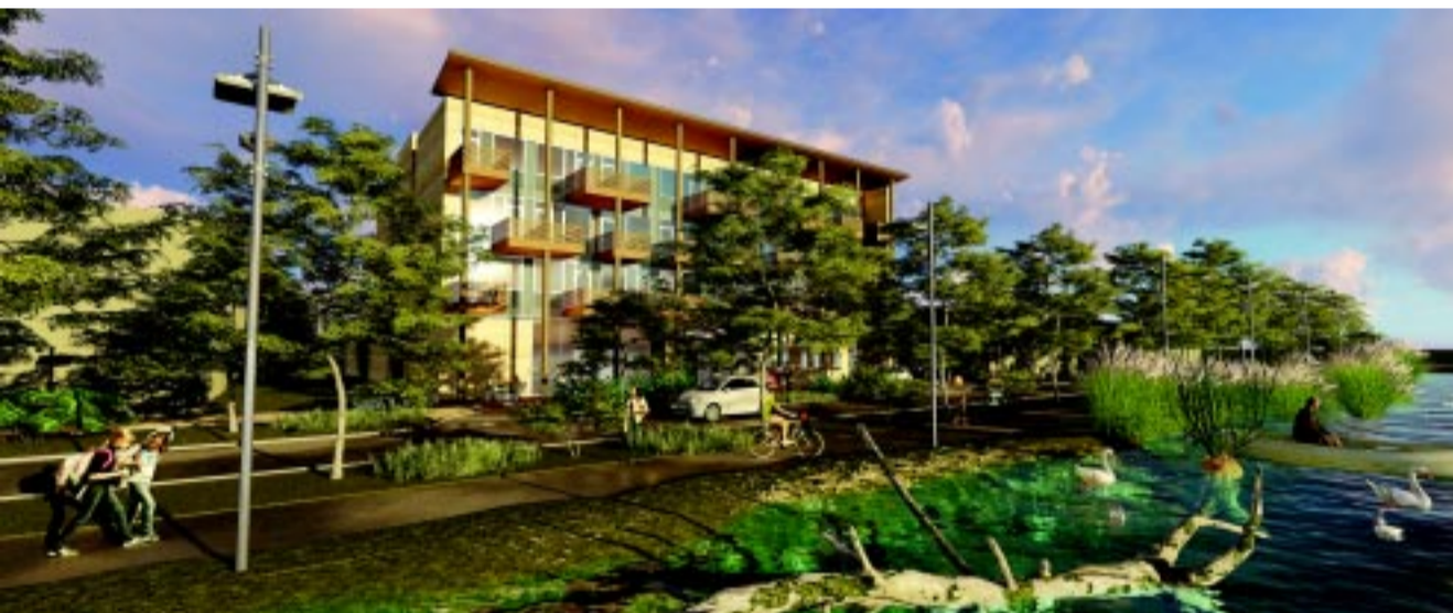
A Pangea Ökocentrum és a részben megújuló Blaha Lujza sétány látványterve

renc által aláírt megállapodás egyik lényeges pontja volt az állatpark további fejlesztése. Mára konkretizálódott az összeg, ami összességében 6,7 milliárd forint. Ebből 1,5 milliárd a TOP forrásokból, 5,2 milliárd pedig a hazai költségvetésből érkezik.