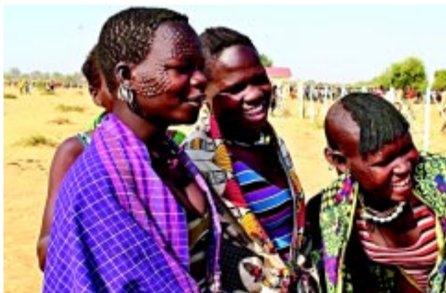
Hegtetovált karamojong lányok