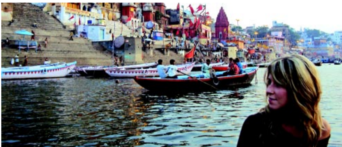
Váránasi, a Gangesz partján elterülő ősi szent város a hinduk zarándokhelye