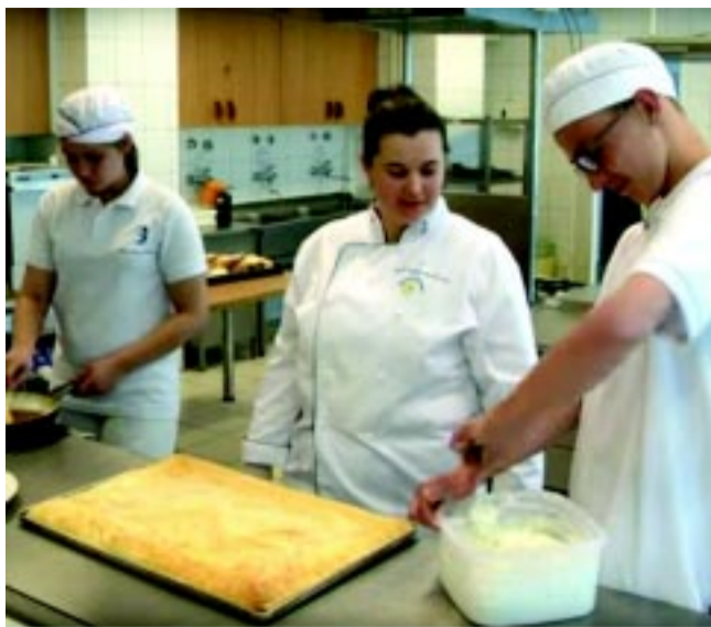
Már gyakorolnak a diákok a nem mindennapi vállalkozásra