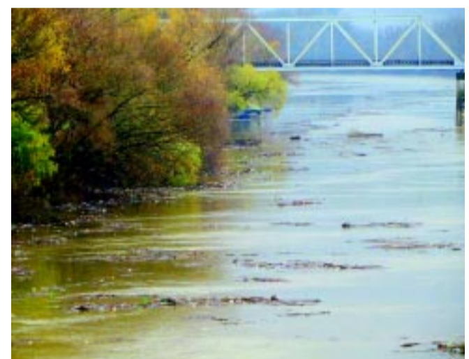
Gyakori látvány a folyóinkon