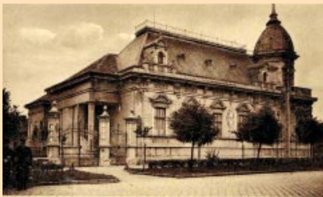
Az Angolkisasszonyok Nyíregyházi Jézus Mária Intézetének épülete az Úrvendégek utca felől