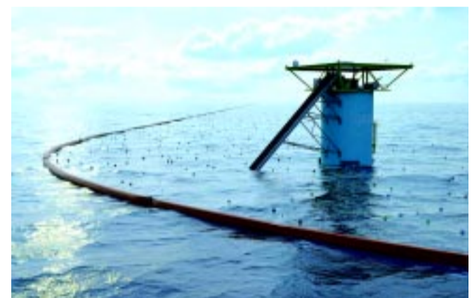
Úszógát a Csendes-óceánon