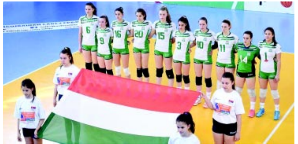
A magyar U16-os válogatott még kijuthat az Eb-re