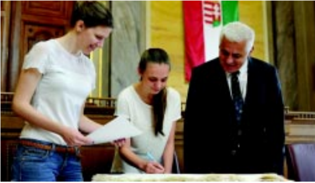
Dr. Kovács Ferenc polgármester a végzős diákokkal

Összesen 20 középiskola végzős osztályainak névsora került be a Ballagók Kapcsos Könyvébe a városháza Krúdy-termében. Nyíregyháza önkormányzata sok sikert kívánt a diákoknak az érettségéhez, valamint a későbbi tanulmányaikhoz, és visszavárják őket a városba.