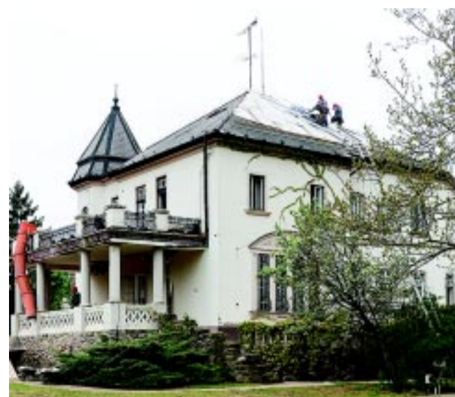
Megkezdődött a Bencs Villa felújítása. A patinás épületet több mint 300 millió forintból alakítják át.