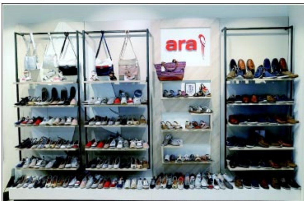
Az ARA shop in shop a Sávház alatt szeretettel várja kedves vásárlóit! Trend Cipő Nyíregyháza, Zrínyi Ilona u. 8-10.