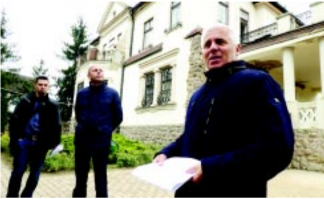
Dr. Kovács Ferenc polgármester a helyszínbemjáráson

A Bencs Villa átalakításával egy többfunkciós turisztikai attrakció jöhet létre. A projektben nagy hangsúlyt kap a minőségi turizmus feltételeinek kialakítása és egy olyan attrakció létrehozása, amely színesíti a város látványosságait és programkínálatát, új élményelemekkel gazdagítva. Az épület külső megjelenésében teljességgel megőrzi az eredeti for-