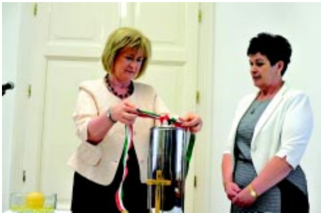
A bővítésre időkapozsula is emlékeztet majd

Addigra persze a roskadozó falak helyett egy kívül-belül felújított intézményből fognak ezek a hangok kiszűrődni. A mellette lévő épületben működő Szent Imre óvoda ugyanis olyan népszerűségnek örvend, hogy már így is szűkösen férnek el ott a kicsik, ráadásul a következő tanévtől a gyer-