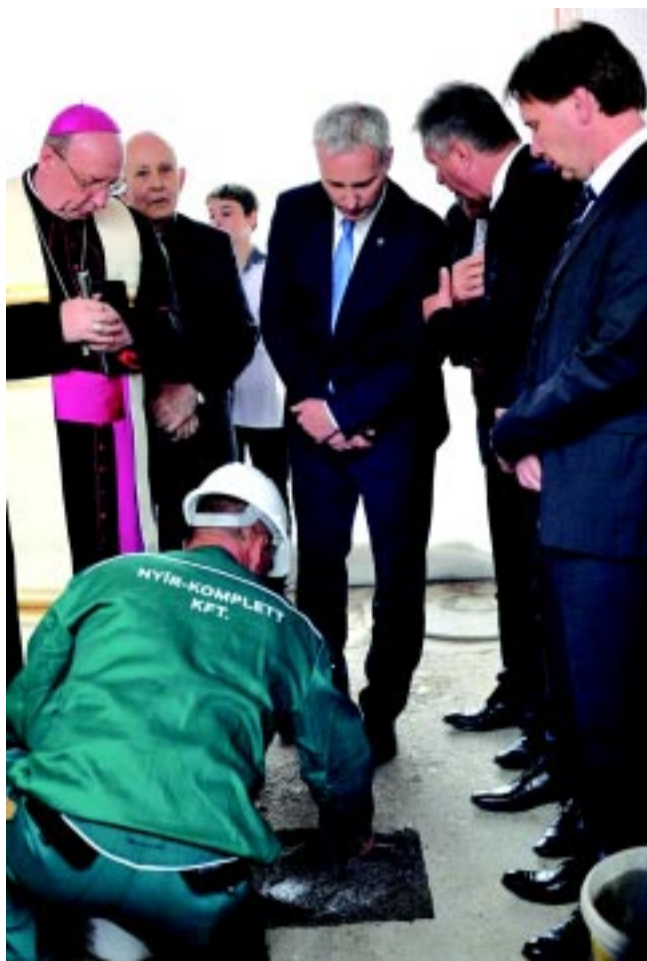
Elhelyezték az óvoda új szárnyának alapkövét

A megnyitón részt vett Soltész Miklós egyházi, nemzeti és civil társadalmi kapcsolatokért felelős államtitkár is, aki kiemelte, a felekezeti iskolák és az oda járó gyerekek száma az utóbbi évtizedekben jelentősen megnövekedett, ma közel 220 ezren járnak egyházi intézményekbe, amelyek közösségeket és értékeket teremtenek.