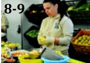
5000 ÉHES SZÁJ