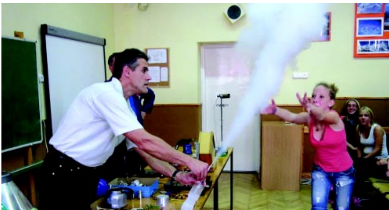
Szökőkút folyékony nitrogénnel