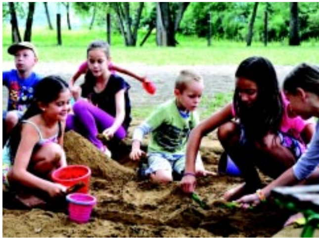
Képünk a Kis Vakond Táborban készült