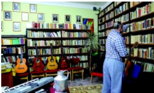
Az intézet könyvtára is népszerű a fogvatartottak körében

– Mindezeket felül lehetőség van úgynevezett jóvátételi munkára is, ami azt jelenti, hogy a fogvatartottak szabadidejük terhére társadalomnak hasznos munkát végeznek.