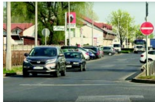
A Tünde utcáról egy darabig nem lehet behajtani a Lujza utcára