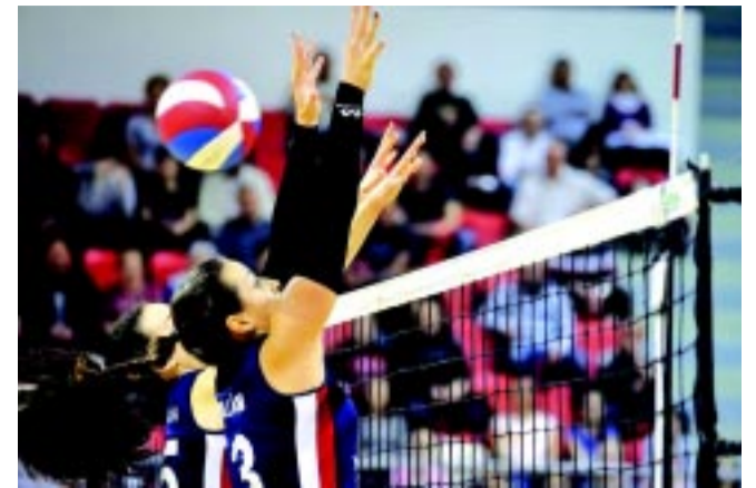
A jó blokkokra pénteken is szükség lesz

némileg megpeccsítették a sorsunkat. De nincs semmi veszve, ez még csak az első meccs volt, a továbbiakban a hátralévőkre kell majd koncentrálnunk – mondta a tréner.