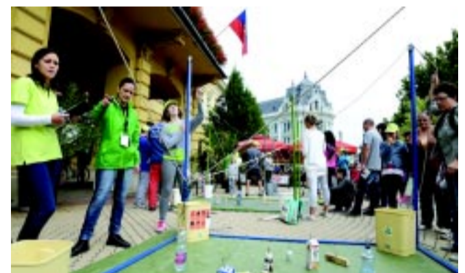
Szelektív szombat

Ahhoz, hogy minél hatékonyabban működjön Nyíregyházán a szelektív hulladékgyűjtés rendszere, szükség van a lakosság tájékoztatására, szemléletformálására, melyet a THG Nonprofit Kft. kiemelt feladatának tart, s a városvezetés környezetvédelem iránti elkötelezettségét mutatja, hogy ezt az önkormányzat Környezetvédelmi Alapja is támogatja.