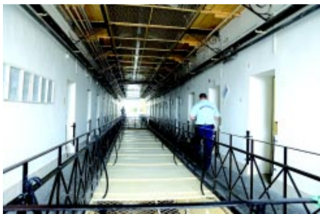
A börtönfolyosó. Innen nyílnak a zárkák.

– Az intézet 142 fő befogadására lenne alkalmas az uniós normák szerint, sok esetben azonban ezt pár százalékkal túl szoktuk lépni, hiszen van egy úgynevezett befogadási kötelezettségünk – folytatja az intézet bemutatását a parancsnok. A legfiatalabb fogvatartottunk 14 éves, ez az alsó korhatár, legfelső viszont nincs. Volt már nyolcvan éven felüli fogvatartottunk is.