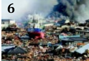
6 KÉT BŐRÖNDDEL

NYUGDÍJASOK. Folytatódik a Szépkorúak Akadémiája, a Júlia fürdőben pedig a nyugdíjasok számára biztosított a kedvezményes belépőjegy.