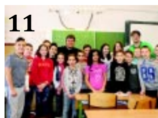
11 NYÍREGYHÁZI OSCAR