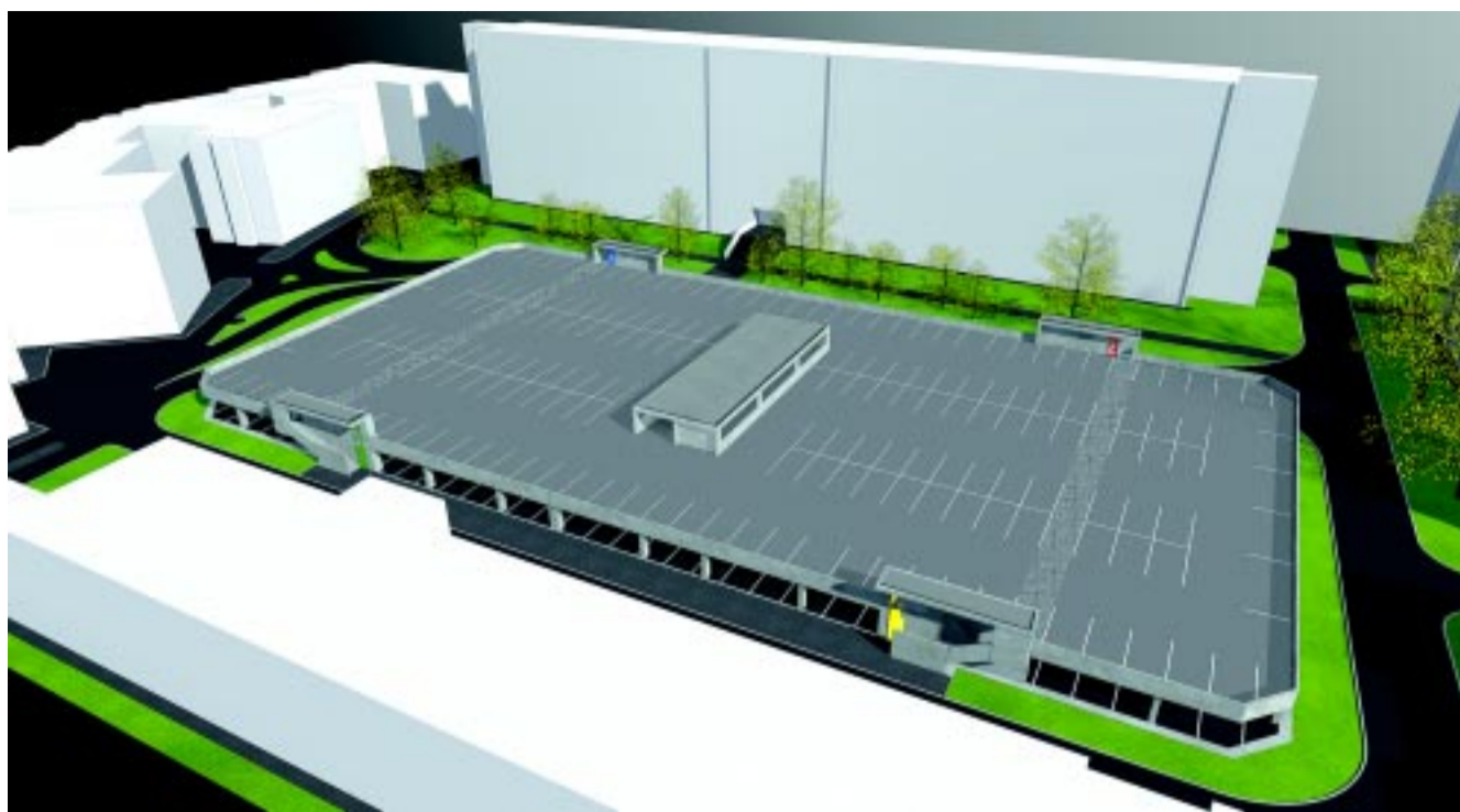
A kétszintes parkolóház látványterve

viszont sokszor szabálytalanul akadályozzák az autósok, a sárga és fehér felfestett vonalakra állva. Ez a szűk keresztmetszetből adódó probléma oldódik meg hamarosan.