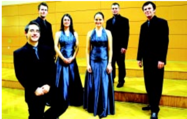
A Banchieri Énekegyüttes

– Igen, nem volt ezzel gond, de ma már más a világ, másképp működnek a dolgok! Sokat gondolkodom a munka és a család közötti egyensúly megteremtésén.