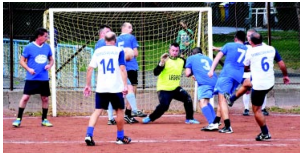
Április 3-ától ismét benépesülnek a kispályák

Április elején rajtol a Városi Kispályás Labdarúgó Bajnokság tavaszi idénye. Több mint hatszáz mérkőzést rendeznek majd a salakos kispályákon. A Városi Stadionban a jövő hónapban beindul az élet, több sportesemény helyszíne is lesz a létesítmény.