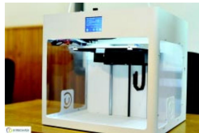
A 3D nyomtató

A Krúdy Gyula Gimnázium a Digitális Mintaiskola Program nyíregyházi mintaintézménye. A projekt 2017-ben indult a digitális pedagógiai fejlesztések első lépéseként. Célja, hogy a digitális kompetenciák elsajátítását biztosítsa mindenki számára, vagyis senki se hagyassa el az oktatási és képzési rendszert anélkül, hogy a munkaerőpiac által elvárt digitális alapkészségekkel ne rendelkezne. A program keretében szeretnék elérni az iskolák teljes, nagy sávzélességű wifis lefedettségét, ami itt a tervek szerint április végéig megtörténik, szintén T-Systems büdzséből. Valamint, hogy az intézmények tantermei rendelkezzenek interaktív táblákkal, 3D-s megje-