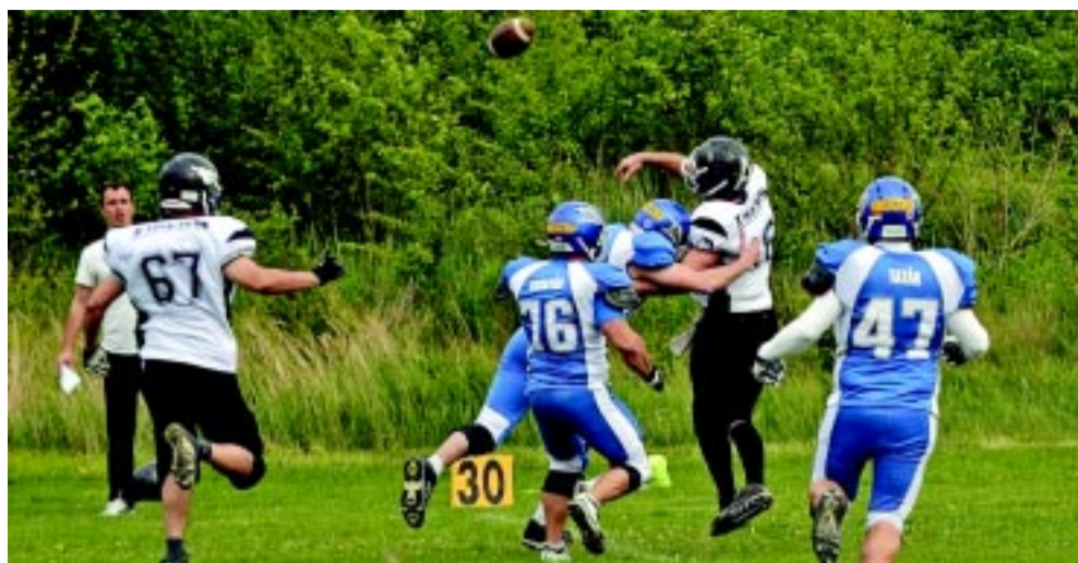
Idén is nagy csatákat vívhat a Nyíregyháza Tigers

A Divízió II-ben indul a következő szezonban a Nyíregyháza Tigers. A csapat lehetőséget kapott arra, hogy ha úgy gondolja, a következő évben ismét a legjobb között szerepelhet majd a HFL-ben. A klub azt tervezi, akkor már megerősödve, széles utánpótlásbázissal rendelkezve vág neki a bajnokságnak, ezért döntött most úgy, hogy inkább a Divízió II-ben rajtol.