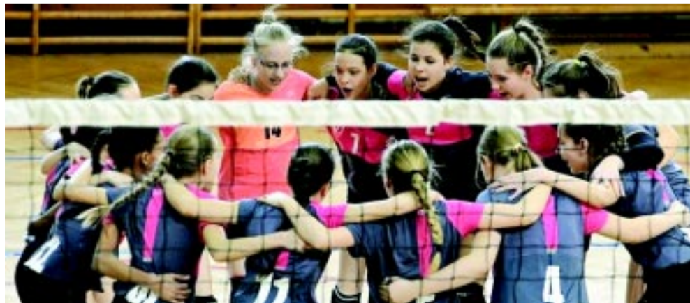
A házigazda Bem csapata bronzérmert szerzett

Nyíregyházát a házigazda Bem, a Móricz és az Arany csapata képviselte. A szakemberek szerint a korosztály nagyon erős, és ez a tornán is látszott, ahol nagy csatákban dőlt el a végső sorrend. Az első helyet végül az Erd szerezte meg, megelőzve a Szolnokot és a Bem iskola csapatát. A Móricz iskola az ötödik, az Arany a 6. helyen zárt. A hétvégén az Országos Gyermekek Bajnokságban is rendeztek mérkőzéseket, itt a Nyíregyháza két győzelmet aratott.