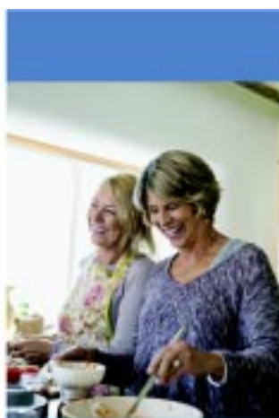
A hallókészüléket ott a legjobb kipróbálni, ahol azt valóban használni fogják.

– Az úgynevezett próbahordás egy remek lehetőség, amit azért is támogatok, mert a hallókészüléket ott a legjobb kipróbálni, ahol azt valóban használni fogják: otthoni, munkahelyi környezetben vagy baráti társaságban. Nem is lehet szakmailag meg-alapozott, felelős döntést hozni enélkül, hiszen minden halló-