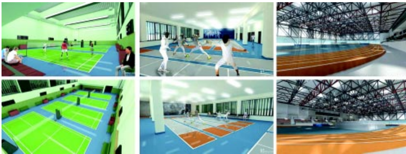
A vívók és a tollaslabdázók is helyet kapnak az új épületben (A fotók tervrajzok, így csupán illusztrációk)

Emellett épül egy körülbelül 5000 négyzetméteres fedett pályás centrum, ami több sportágot is befogad, de a legnagyobb vonzerőt az atlétika jelenti majd. – A SYMA