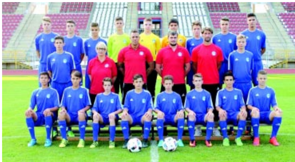
A Bozsik Akadémia U15-ös csapata két győzelemmel kezdte a tavaszt

Elkezdődött a tavaszi szezon a Bozsik Akadémia labdarúgói számára. A csapatok a hétvégén már bajnoki mérkőzéseket játszottak. A szakvezetők azon dolgoznak, hogy a legjobbak bemutatkozhassanak a felnőttbajnokságokban.