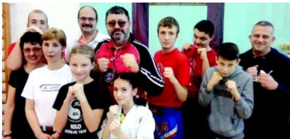
A Tai Qi Boxing eredményes csapata