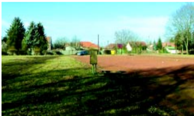
Most így néz ki az elhanyagolt terület, de a szabadtéri rész is megújul a projektben

csarnok mellett, amelynek bezárásáról is szólnak hírek, ez lesz Magyarországon az egyetlen olyan, 200 méteres, szabvány fedett pálya, lelátóval, amely alkalmas lesz országos és nemzetközi versenyek rendezésére. De nemcsak nálunk lesz különleges, hiszen a környező országok atlétáinak is jó lehetőséget jelent majd. Tervezünk egy kisebb sportszállót, így akár versenyek, akár edzőtáborok miatt is népszerű lehet Nyíregyháza a lengyel, szlovák, román sportolók körében amellelt, hogy minden igényt