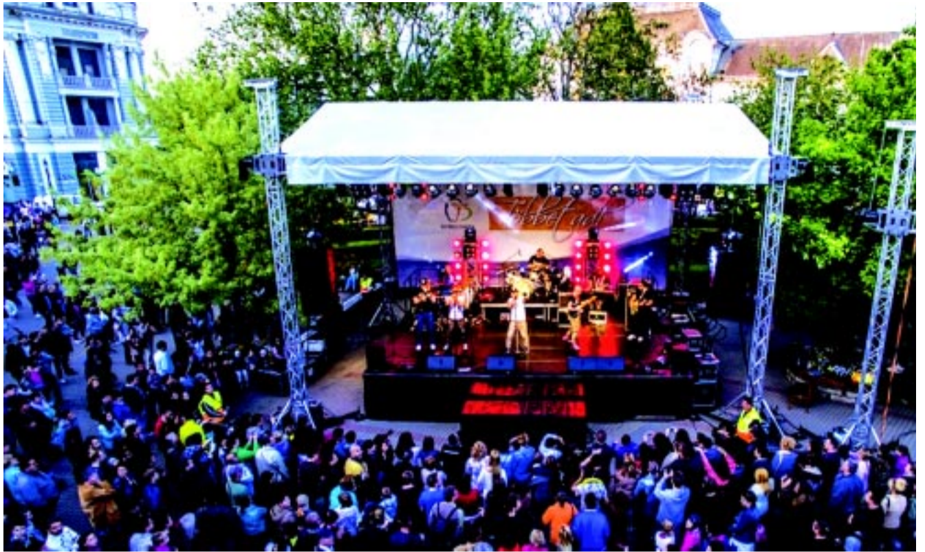
A „Helló Nyíregyháza” nagyrendezvény tavaly is nagy sikert aratott

A polgármester még a napirendi pontok tárgyalása előtt jelentette be azt a hírt is, hogy a város 100 százalékos