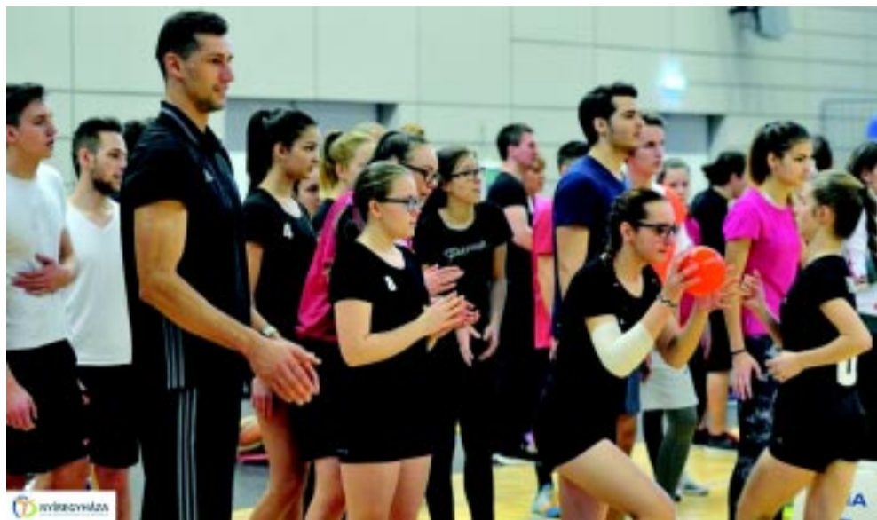
Profi sportolók is segítettek a diákokat

24 órás sportágválasztót tartottak Nyíregyházán, két részletben. Előbb a középiskolások ismerkedhettek meg a különböző sportágakkal, majd az általános iskolások vették birtokba a Continental Arénát.