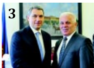
3 MINISZTERI VIZIT