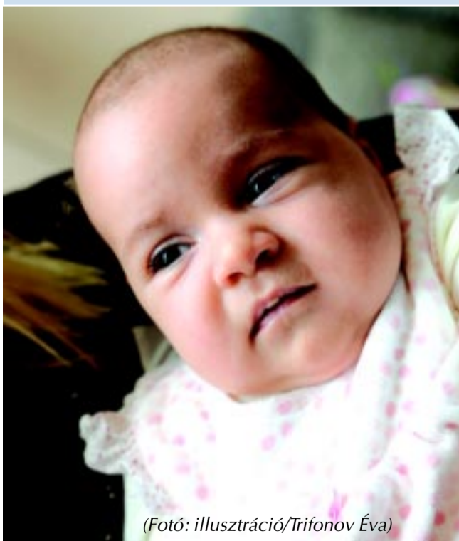
(Fotó: illusztráció/Trifonov Éva)

– Nem egy olyan pácienssel találkoztam a praxisomban, aki hosszú ideig járt vizsgálatokra, de nem akart sikerülni a terhessége. Az elkeseredettség miatt aztán letett róla, hogy anya lehet, és még a menzesze is megállt. Aztán kiderült, hogy ott van a pocakjában a 10–12 hetes embrió. De olyan betegem is volt, nem is régen, aki túl volt öt vetelésen. A negyedik után pszichésen már nehezen lehetett támogatni, kezdte elveszíteni a türelmét, de a hatodik terhessége már sikerült.