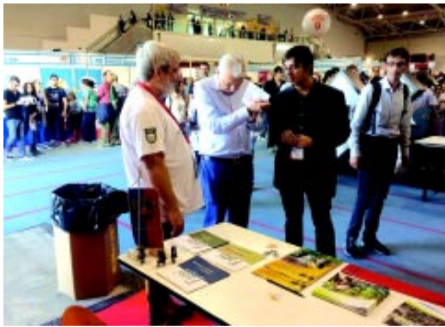
Tavaly a Bánkirobot csapat tagjai az okos tűzoltókat Rómában mutatták meg