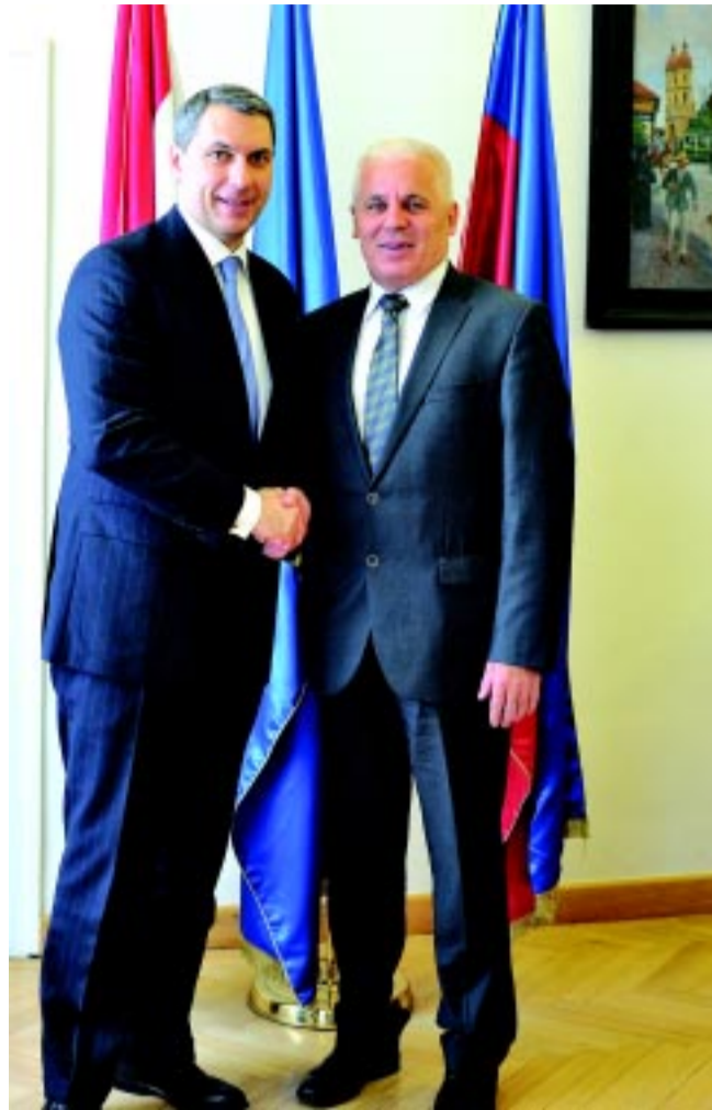
Lázár János, Miniszterelnökséget vezető miniszter és dr. Kovács Ferenc polgármester

közeli, és az önkormányzat közreműködésével közösen mintegy 4000 új munkahelyet tudtunk létrehozni. Ez egy fantasztikus eredmény! Nyíregyháza nagyon jól prosper