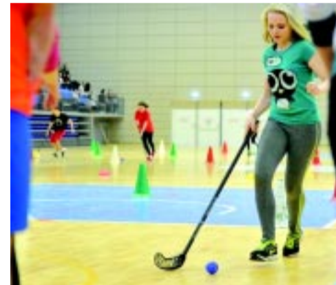
A sorverseny során játékos feladatokat vártak a fiatalokra

A város kiemelten támogatja az utánpótlás- és szabadidősportot. Egy-egy ilyen rendezvény jó alkalom arra, hogy a fiatalokhoz közelebb vigyék a mozgást. A Diáksportparlament ülésén is szóba került a sport.