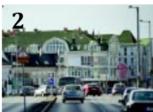
2 FORGALMI REND