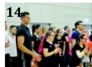
14 HISZEK BENNED