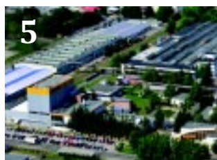
5 ÚJ MUNKAHELYEK

NAGYBŐJT. A héten a katolikus egyházban elkezdődött a húsvét előtti felkészülés időszaka, a szent negyven nap, vagyis a nagyböjt.