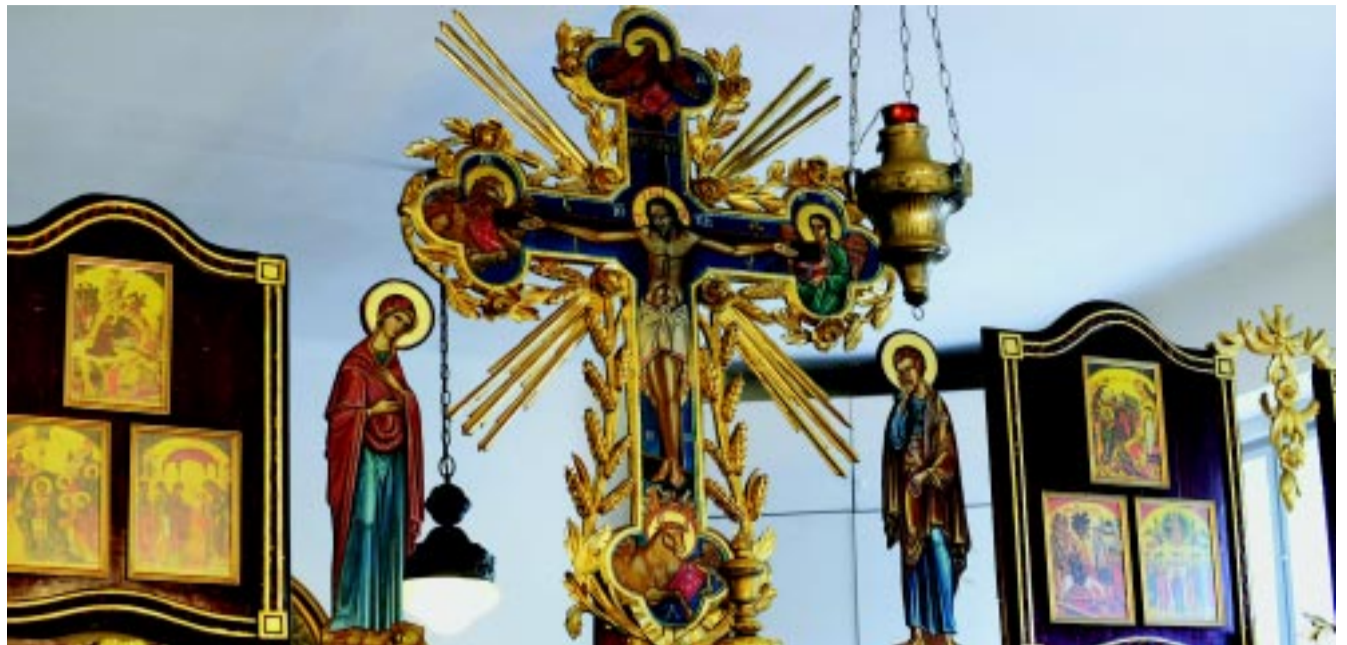
Az ortodox egyház kápolnája Nyíregyházán