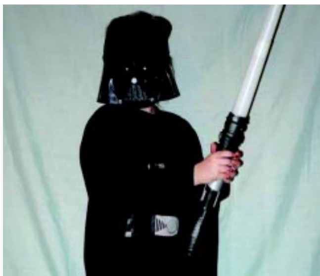
Nagy kedvenc a Star Wars jelmez

– Az eddigi legkülönlegesebb kérésünk az volt, amikor bejött hozzánk egy anyuka és közölte, hogy a kisfiának tárgynak kell lennie farsangkor. Sokáig csend volt, majd a csillagfejű csavarhúzóban megegyeztünk... – mesélte a jelmezkölcsönzős.