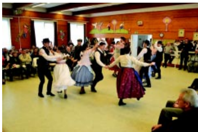
Az eseményt táncház zárta

A nap folyamán az Igrice Néptáncgyűttes tagjai bemutatták az úgynevezett tálaló legények toborzását – a régi lakodalmakban a vacsora feltalálásához toborozták a legényeket –, a nagyvőfélyek közreműködésével pedig az asztalra került a menyasszonyi torta, de volt bolond esküvő és még menyasszonyszökettetés is. A napot táncház zárta.