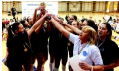
A Vasvári leány röplabdásai megnyerték a diákolimpiai döntőt

Bajnokok: Kézilabda lány: Győr. Kézilabda fiú: Balatonboglár. Röplabda lány: Nyíregyházi Vasvári Pál Gimnázium. Röplabda fiú: Dunaújváros. Kosárlabda lány: Pécs. Kosárlabda fiú: Körment.