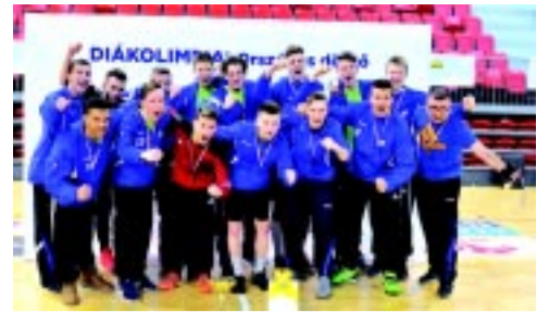
Az Arany János Gimnázium bronzérmes kézilabda-együttese