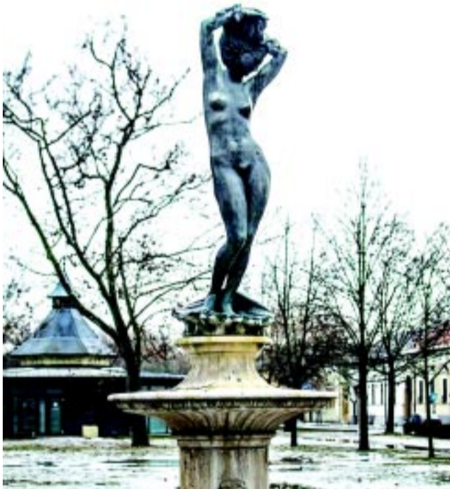
Vénusz szobor a Benczúr téren