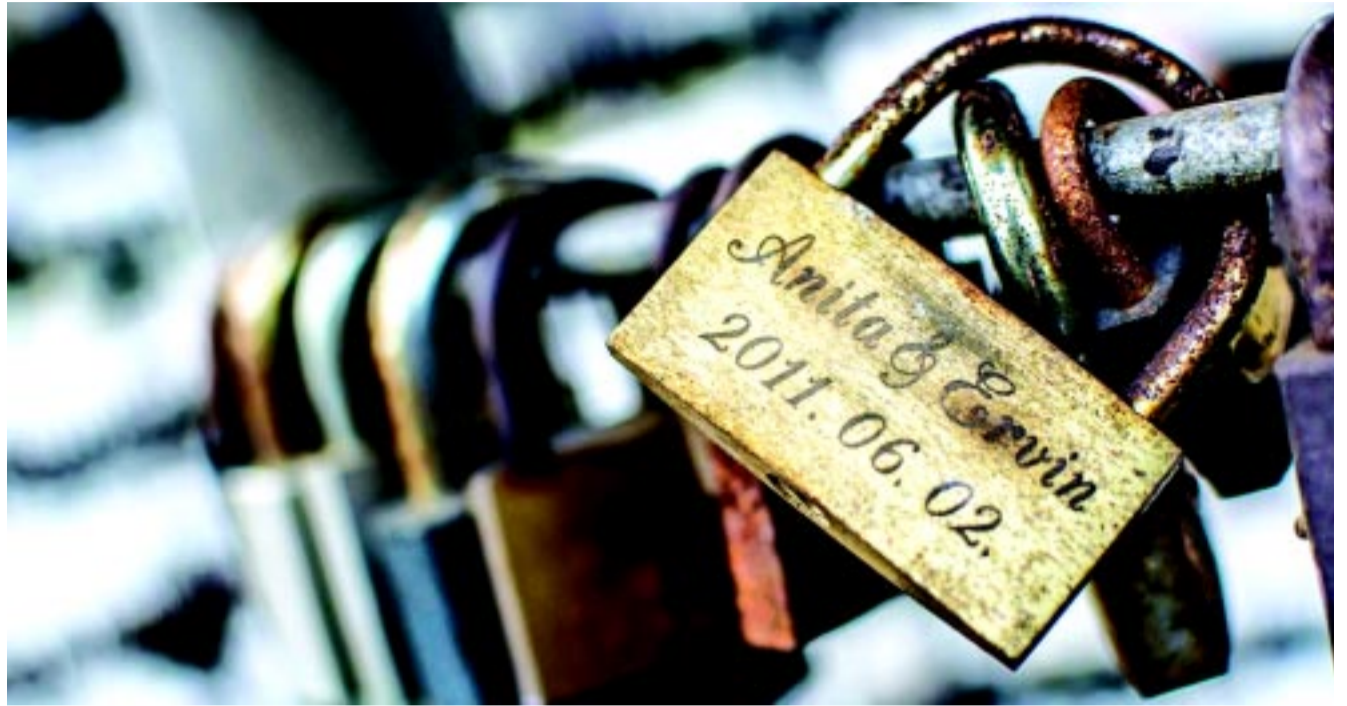
Több tucat lakat sorakozik a „szerelemketrecen”

Városunkban is ellátogathatnak a párok a római szerelem és szépség istennőjének, Vénusznak a szobrához, amely a Benczúr téren kapott helyet 1930-ban. Kisfaludi Strobl Zsigmond ajándékozta Nyíregyházának az alkotást, és azt a pillanatot testesíti meg, amikor a szerelem istennője kilép a tenger sós vizéből.