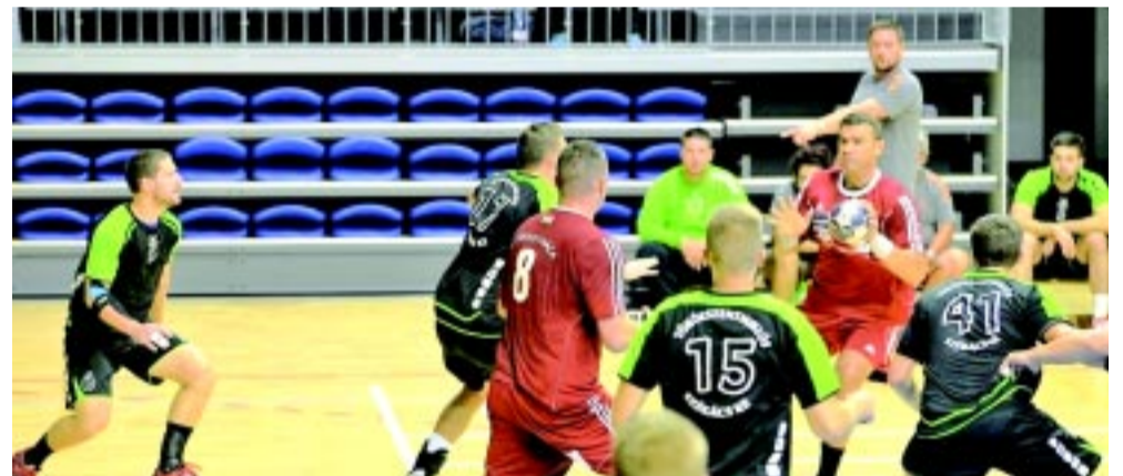
A nyíregyháziak szeretnék ismét dobogón végezni

A hétvégén folytatódik a férfi kézilabda NB I/B-s bajnokság. A Nyíregyházi SN Törökszentmiklósról látogat. A csapat felkészülése jól sikerült, és szeretnék a szezon végén ismét dobogóra állni.