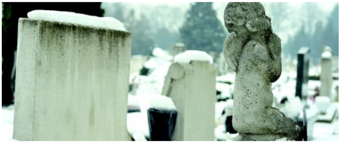
Az Északi temető télen is méltóságteljes

A lepusztult állapotban lévő téglakerítés duplán balesetveszélyes, hiszen az egyik oldalán a forgalmas kerékpárút fut, a másik oldalán pedig síremlékek vannak. Róka Zsolt