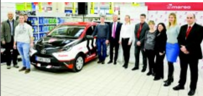
A felajánlók és az autó boldog tulajdonosa

A több mint 25 éves múltra visszatekintő magyar vállalat, a MARSO Kft. volt a kezdeményezője és szervezője annak a közös projektnek, amelynek eredményeképpen két világszerte ismert nagyvállalattal – az Auchan és a Bridgestone – közösen hirdetett meg promóciót. A legálább négy darab Firestone gumibroncsot vásárlók egy gyors online regisztrációt követően vehettek részt a játék-