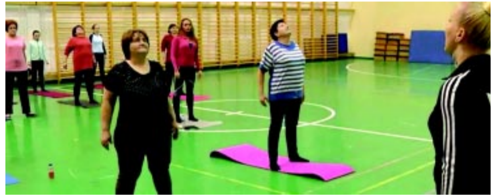
...és Nyírszőlősen is

(Szerző: Mikita Eszter, Z. Pintye Zsolt)