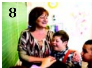
8 NAGYDÍJAS FOTÓK

10 KULTÚRA NORVÉG TÁNC. Egy nemzetközi projekt keretében bemutatkozott és tanított is a 4 for Dance, a nyíregyházi sikercsapat Norvégiában.