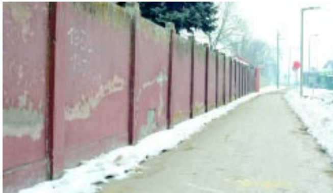
Megérett a felújításra a kerítés

A lepusztult állapotban lévő téglakerítés duplán balesetveszélyes, hiszen az egyik oldalán a forgalmas kerékpárút fut, a másik oldalán pedig síremlékek vannak. Róka Zsolt