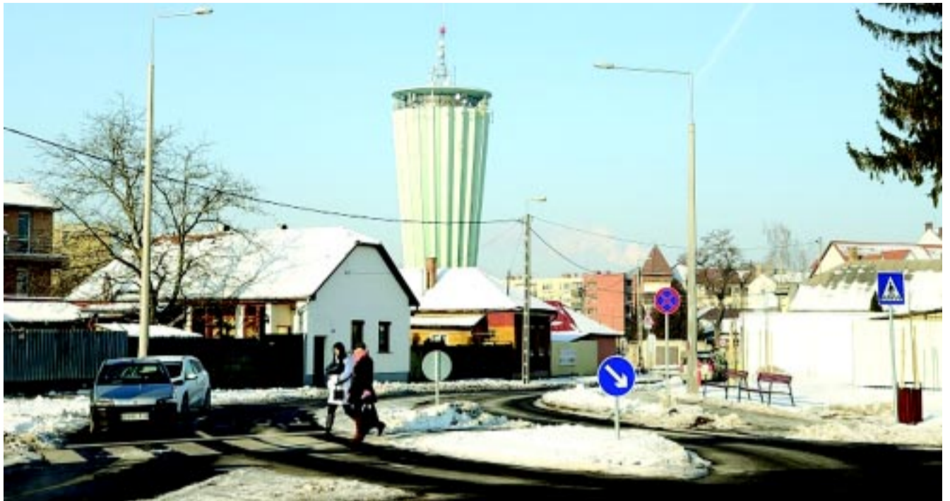
A csomópont átépítésével biztonságosabbá vált a közlekedés az érintett útszakaszon

A pályázat második szakasza a borbányai városrészt is érinti majd, így ez a terület is bekapcsolódhat a város kerékpárút-hálózatába.