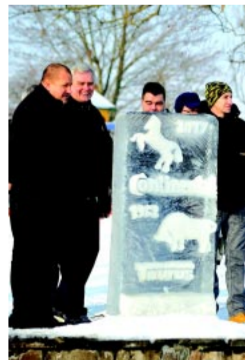
A Continental győztes jég-szoborra

A szervezők melegedősátorokról, ételről és forró teáról is gondoskodtak. Sokan kihasználták a jó időt és a versenyek után is ott maradtak a jégen korcsolyázni, illetve jégkorongozni. A hokisoknak külön területet is kialakítottak. A Sóstolimpia nagy sikert aratott, így biztosan nem ez volt az utolsó ilyen verseny a tavon.