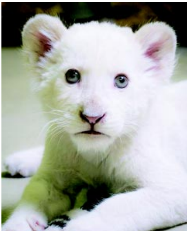
Kókusz már öt hónapos

A látogatócentrum építése tavasszal kezdődik, és a nyár közepén már birtokukba vehetik a vendégek. Itt Nyíregyháza és Sóstógyógyfürdő programjait, látványosságait ismerhetik meg az érdeklődők, de egy „mini múzeum” is helyet kap benne, amelyben a park történetével lehet majd megismerkedni, és látható lesz az alapító oroszlán tappancsának lenyomata is. Mindezen túl pedig folyamatban van a park teljes úthálózatának felújítása. Az elképzelések alapján a jövőben kiszélesített és díszburkolattal ellátott úton sétálhatnak azok, akik kíváncsiak a Nyíregyházi Állatpark csodáira – tudtuk meg az igazgatótól.