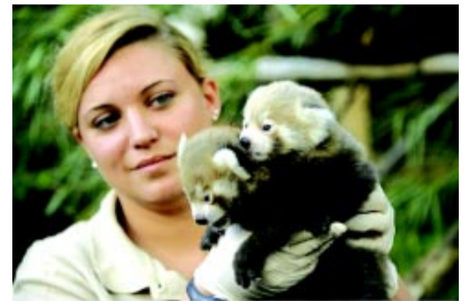
Nyáron nagy szenzációnak számított, amikor megszülettek a kis pandaikrek

2016-ban több mint 480 ezer ember volt kíváncsi a 30 hektáron bemutatott különlegességekre. A látogatók fele magyar volt, a külföldiek közül a legtöbben pedig Szlovákiából és Lengyelországból érkeztek, de egyre több nyu-