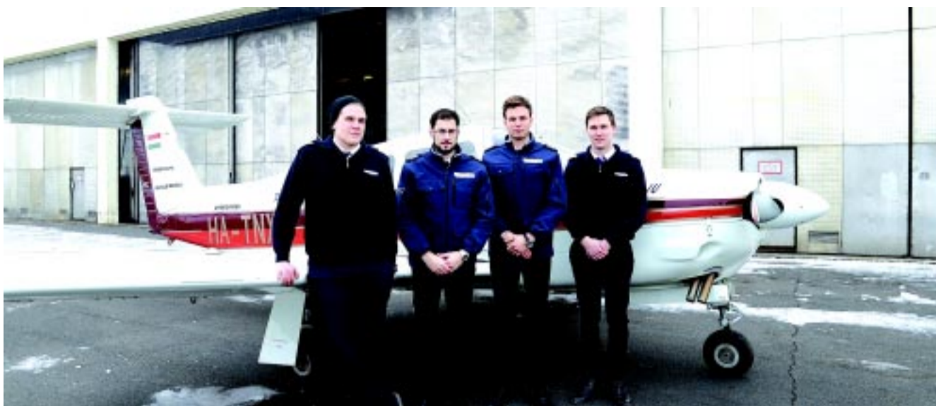
A jövő pilótái a Tréner Kft. egyik gépe előtt