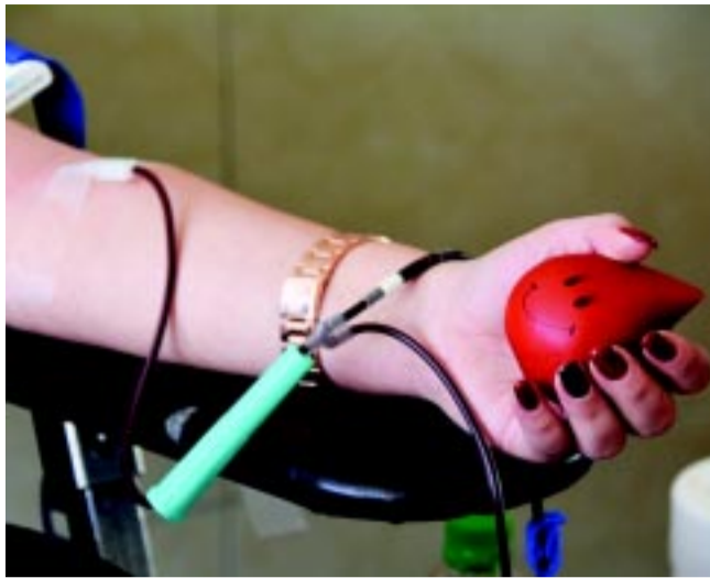
A koordinációs igazgató elmondta, minden vércsoportra egyaránt szükség van, hiszen ezek felhasználásának ará-

A folyamatos ellátás biztosításához mindennap szükség van a véradók segítségére. A Magyar Vöröskeresztnek például naponta 1800 donort kell toboroznia ahhoz, hogy a kórházi ellátáshoz szükséges mennyiség rendelkezésre álljon. Ez pedig különösen nehéz most, a téli időszakban, amikor sokan szenvednek influenza megbetegedésektől.