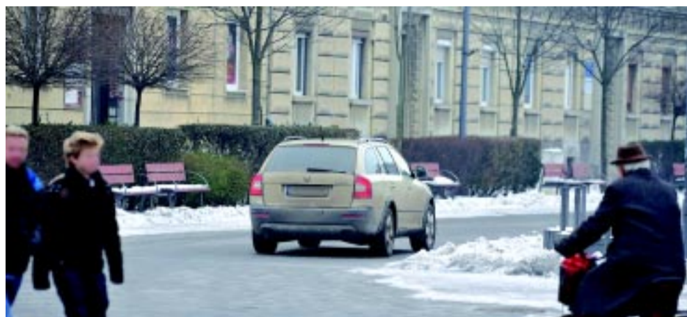
Sokan lerövidítik az utat a Korzónál, szabálytalanul