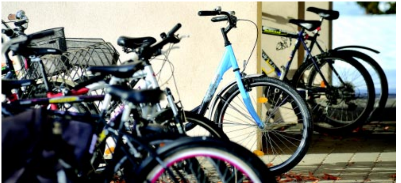
A háttér még hófehér, de ha kizöldül, csak szürkével lehet ezeket szállítani

A hivatalos szabályozás szerint csak úgy lehet az autó hátulján biciklit szállítani, ha a rendszámot takaró, hátsó ajtóra, vagy vonóhorogra szerelt kerékpártartón külön lámpasorral egybeépített rendszám-tartó van. Így nem kell minden alkalommal átszerelni, ez a lényege a szürke rendszámnak, hiszen a kerékpártartó külső konzolján az eredetivel egyébként megegyező, csak szür-