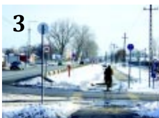
3 NYÁRON TOKAJIG