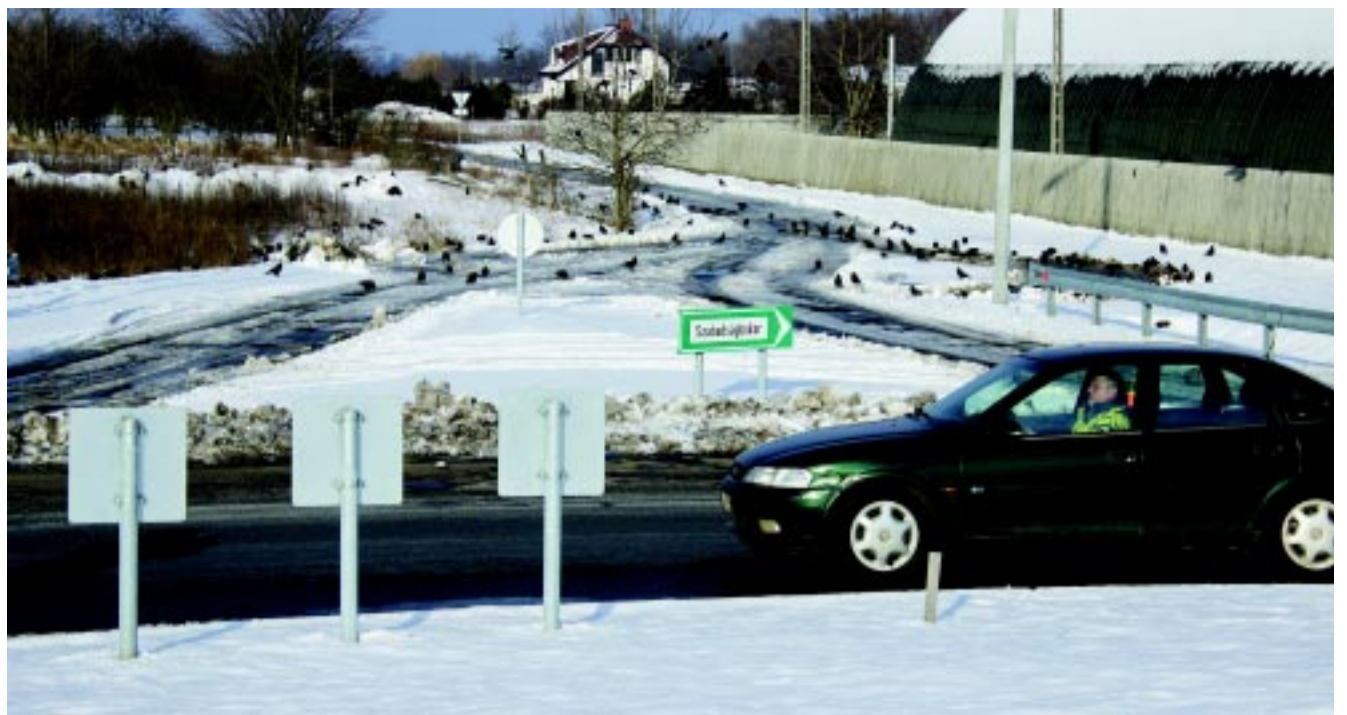
Nemsokára a Tiszavasvári út másik oldalán is folytatódni fog a Nyugati elkerülő, Nyírszőlős irányába

– Egy 7,7 kilométeres szakasz van még hátra, amely a 36-os számú főutat köti majd össze a Nyírszőlősi úttal. Ennek érdekessége, hogy ez fogja keresztezni a Budapest–