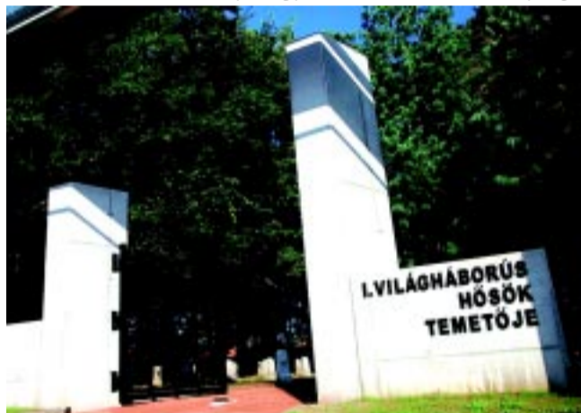
Az értékek közé került Hősök temetőjét tavaly 20 millió forintból újíttotta fel az önkormányzat

Elfogadták a Nyíregyházi Települési Értéktár Bizottság 2014. második félévben végzett tevékenységéről szóló beszámolóját is. Ebből kiderült, hogy a nemzeti értékek sorába felkerült Bárany Frigyes művészeti tevékenysége,