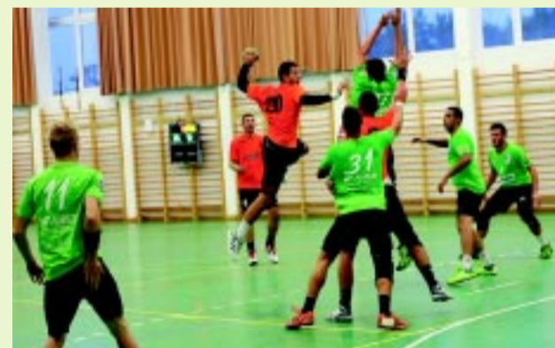
Tavasszal nagy csaták várnak az NYKC-ra

Az első négy forduló eldöntheti a bajnoki cím sorsát. Három meccset a közvetlen rivális ellen vív a jelenleg harmadik helyen álló Nyíregyházi KC, így a Ferencvárossal, az Egerrel és a Kecskeméttel találkozik. – Sikertől elvégeznünk azt a munkát, amit elterveztünk. Öt hét állt rendelkezésünkre, amit úgy zártunk, hogy élvonalbeli csapatok ellen játszottunk, és nem is vallottunk szégyent. Mindenképp szeretnénk volna erős együttesekkel találkozni, mert a tavaszi rajt nyitányán is olyan