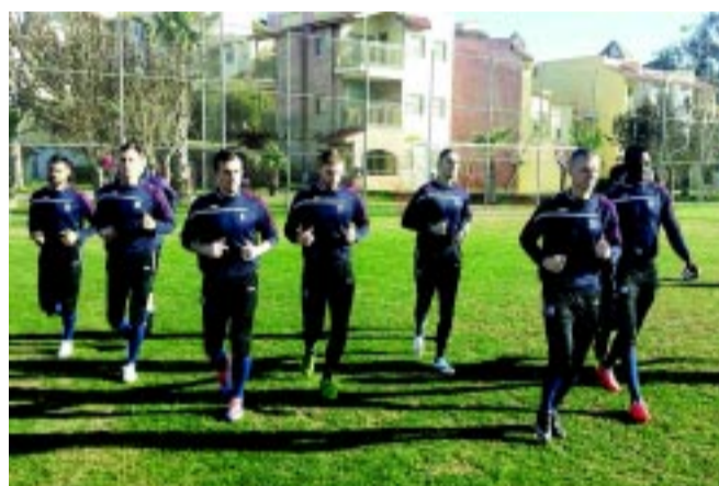
Törökországban ideális körülmények között készülhet a csapat