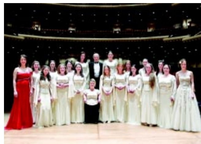
A Pro Musica Amerikát is meghódította