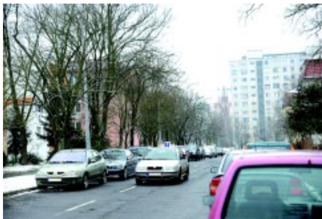
Parkolásgyakorlás a Schmidt Mihály utcában

Kedves Napló! Az olvasó észrevételét felháborítónak tartom, hisz aki jelezte ezt a problémát, feltehetőleg ő is volt egykoron tanulóvezető. Mielőtt a tanulóvezető kikerül a forgalomba, az alapoktatás keretében, a rutinpályán belül megtanul parkolni, s a forgalomban csak a gyakorlást végzi, amire kiemelten szükség van, hisz a forgalmi vizsga megköveteli a parkolás végrehajtását egy adott vizsgautóvonal-szakaszon. A vizsgautóvonalakat egyébként a Szabolcs-Szatmár-Bereg Megyei Kormányhivatal Közlekedési Felügyelősége határozza meg. Ha az észrevétel írója jár a városban, tudhatja, hogy nem csak a Schmidt M.