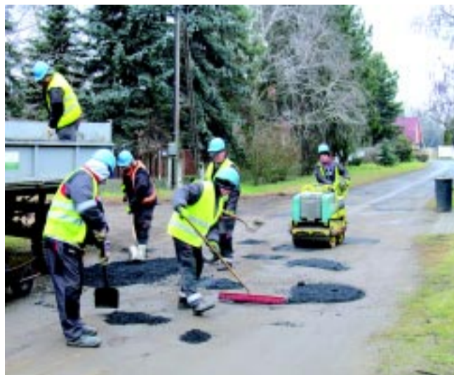
Az utat javítják a városüzemeltetés szakemberei

A munkálatokra azért volt szükség, mert a járdával nem rendelkező közterületen sok kátyú volt, amely a gépkocsiban és a gyalogosokban is kárt tehet. Mivel az időjárás a melegaszfaltozást nem teszi lehetővé, így a munkások a -20 foktól alkalmazható hideg aszfalttal javították ki az úthibákat.