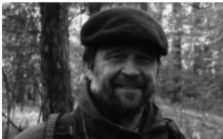
Normantas Paulius fotóművész, 1948–2017

Komolyan vett mindent és mindenkét. Megszállott volt.