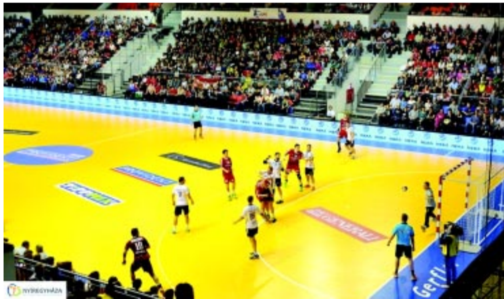
Teljesen megtelt a férfi kézilabda-válogatott meccsén a Continental Aréna