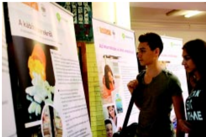
Számos középiskolában hívják fel a fiatalok figyelmét a drog veszélyeire (fotó: illusztráció)

A D.A.D.A. (Dohányzás-Alkohol-Drog-AIDS) Program 1992-es indítása óta hosszú és viszontagságos utat járt be. A húsz éve még kísérleti program azóta sikeressé válva, ma már jóval több iskolához jut el. A D.A.D.A. lényege, hogy a rendőrkapitányságok állományából kiképzett, hivatásos rendőrök foglalkozásokat tartanak a tanulóknak.