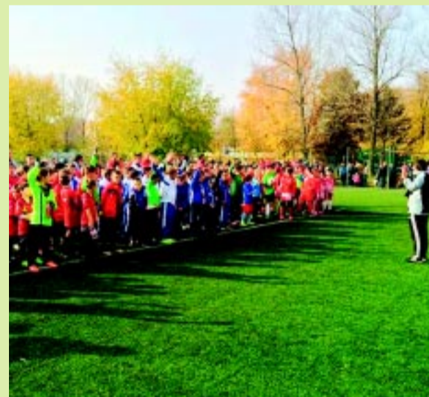
Több mint kétszáz gyerek focizott a Városi Stadionban

Az MMS Liga harmadik fordulójában a Nyírsuli legkisebb labdarúgói egy négyes tornán vettek részt a nyíregyházi Városi Stadionban a DVTK, a Debreceni Olasz Focisuli és a Hajdúböszörmény 8–11 éves csapatai ellen.