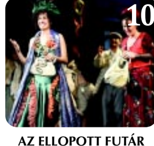
AZ ELLOPOTT FUTÁR

8 ALAPELLÁTÁS: EGYRE JOBB ALAPOK. 20 éves a Nyíregyházi Napló. Most, két évtizeddel egy cikk megjelenését követően utánajártunk, hogyan változott az alapellátás színvonala Nyíregyházán.