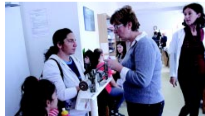
Várandósgondozás a Stadion utcán

Ugyan nem az alapellátás része, de egy régi álom valósult meg a Fürdőház gyógyászati részlegében. Ez nemcsak fizioterápiás kezelésekké bővült, de november elejétől már napi hat órában fürdőorvos is áll a betegek rendelkezésére. A Sóstó-Gyógyfürdők Zrt. új orvosi gépeket vásárolt és száraz gyógytornatermet alakított ki a komplex ellátás érdekében. Az orvos által felírt komplex kezeléshez kedvezményes áron lehet hozzájutni, mivel a TB támogatja. Ami a jövőt illeti, az év elején a reumatológus szakorvos is átköltözik majd az Élmenyfürdő – egyelőre még épülő – új gyógyászati szárnyába, így bízhatunk benne, hogy Nyíregyházán is egyre többen fogják azt mondani: „Köszönjük, jól megvagyunk!”