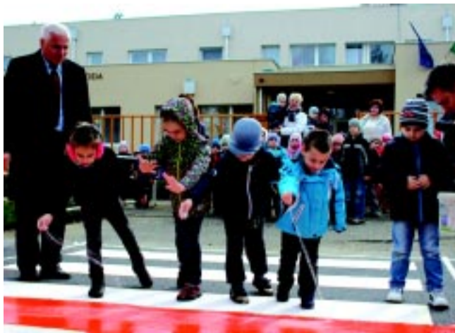
Munkában dr. Kovács Ferenc polgármester és az ovisok

Kifejtette, hogy sokan talán nem tudják, nem egyszerű egy gyalogátkelőhelyet létrehozni, hiszen van engedélyeztetési része és a teljes kivitelezés is kétféle forintba kerül. Nyíregyháza polgármestere elmondta, először 2011-ben kezdték el a piros-fehér fényvisszaverő gyalogátkelőhelyek felfestését, ami a tapasztalatok szerint sokkal hatékonyabb is. Ezért bízik benne, hogy a jövőben egyre kevesebb baleset lesz a városban és a járművezetők is kellő óvatossággal közelítik majd meg a zebrákat.