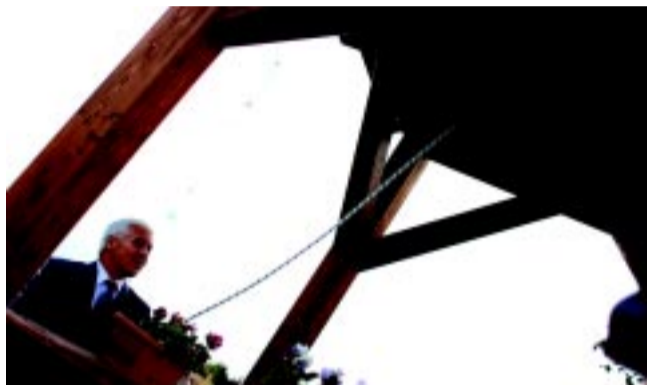
Elsőként Nyíregyháza polgármestere szólaltatta meg az új lélekharangot

A temetőn belüli közbiztonság fenntartása érdekében az Északi temetőben tavaly az önkormányzat 6 darab térfelgyelő kamerát helyezett el 1,3 millió forintos beruházással.