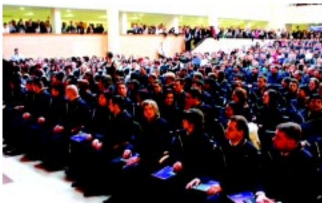
Újabb több ezer diák vágyik erre a felemelő pillanatra a nyíregyházi főiskolákon

Idén is hozta a tavalyi hallgatói létszámot a Debreceni Egyetem Egészségügyi Kara. A nyíregyházi intézménybe 452 hallgató nyert felvételt, ez a szám pontosan megegye-