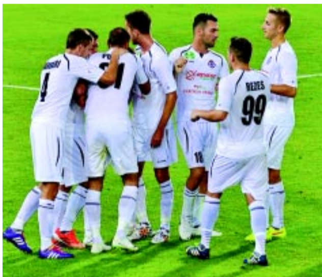
Egy hete a Debrecen ellen már gólt ünnepelhetek a játékosok