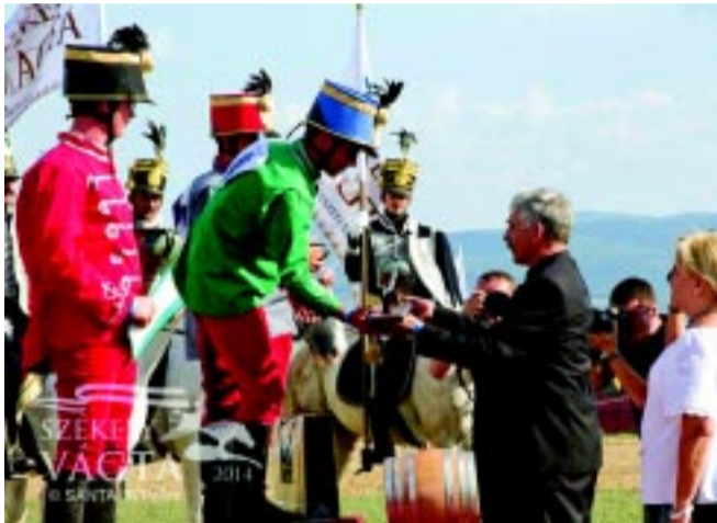
A díjátadás pillanata

A 2014-es Székely Vágtát július 19-20-án rendezték meg az eresztevényi Óriás-Pincetetőn. A Székely Vágta futam