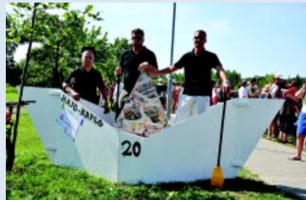
A „Hajó-Napló” kiállta a próbát

Az Úszó Alkalmatlanságok vetélkedője évről évre egyre nagyobb közönségnek biztosít szórakozást. A rendezvényen egyaránt jól érezhette magát a fiatalabb és az idősebb generáció is. A vetélkedőt követően a versenyzőket és szurkolóikat egyaránt a Krúdy Vigadó előtti sétányra várták, ahol a sóstói vendéglátás színé-java felsorakozott ízletes étkeivel. A versengést és a lakomát követően felváltva zenélt a Gombóc együttes, a Kaland Old Rock és a Szívtiproll. A Krúdy sétányon felállított színpadról a tánc sem hiányozhatott, a programot az Eastern Eagles Line Dance táncscapat produkciója zárta.