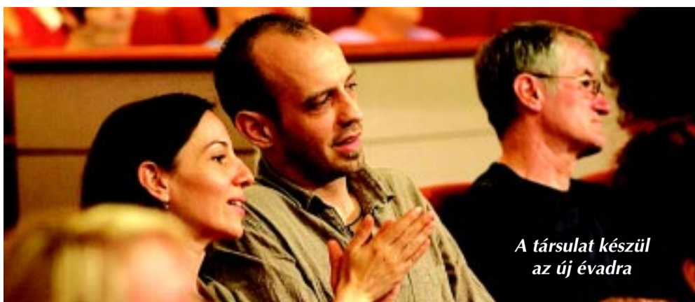
A társulat készül az új évadra

Bár a nyári szünet még javában tart, a színház jövő évadra vonatkozó elképzelései már rég ismertek. A nézők is tervezhetnek: indul a bérletezés július 15-én, kedden. Az előző évadban vásárolt bérletes helyeket augusztus 5-ig foglalják.