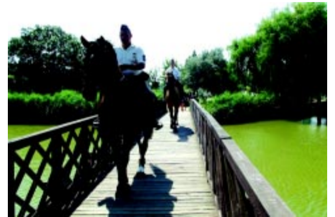
A Szabolcs-Szatmár-Bereg megyei Rendőr-főkapitányság lovasrendőrei is felbukkanhatnak városszerte

A nyári hónapokban a turisztikailag frekventált helyeken kerékpáros járőrök is segítik a lakosságot. Megjelenésükre így leginkább a következő helyeken lehet számítani: Nyíregyháza belvárosában, Sóstófürdőn, valamint a Tisza-parton. A rendőrök célja elsősorban a lakosság segítése, ám ha jogsértést észlelnek, minden esetben megfelelő módon intézkedni fognak.