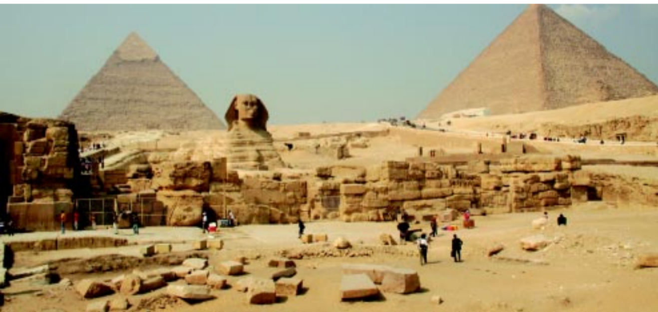
Az egzotikus országokban nem árt az elővigyázatosság