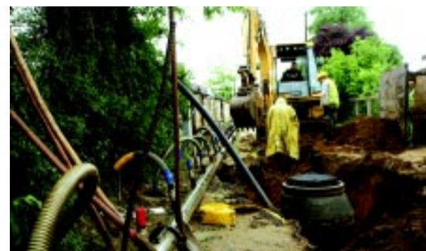
A befejezéséhez közelítő nagyszabású szennyvízprogram folyamatos útlezárásokkal jár

A Nyíregyháza szennyvízprogramja részeként, a Tünde utcában, a Kilátó utca és Lujza utca közötti szakaszon szennyvízcsatorna-rekonstrukciós munkálatok zajlanak július elsejétől.