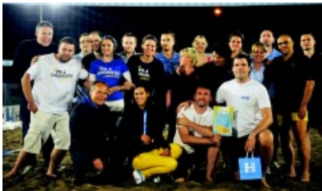
Újságírók a pályán

Szombaton azon nyíregyházi vállalatok mérkőztek meg,