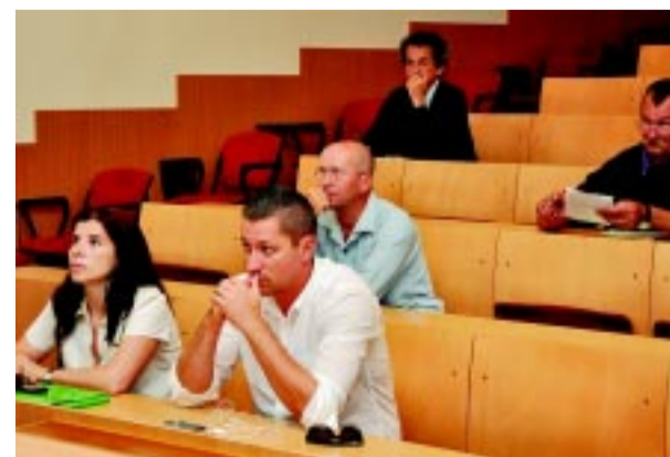
A résztvevők egy csoportja

A fórumokon a résztvevők tájékoztatást kaptak a 2014–2020 között tervezett fejlesztésekről, valamint lehetőséget kaptak a felmerülő kérdések és észrevételek megvitatására.