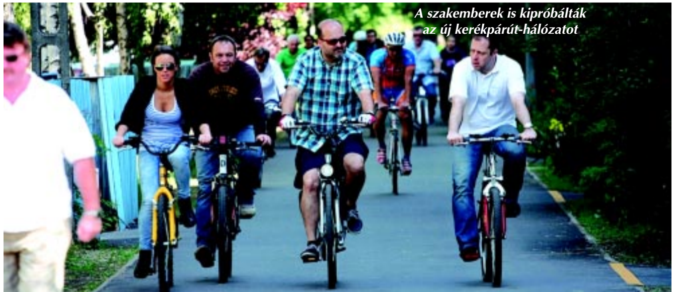
A szakemberek is kipróbálták az új kerékpárút-hálózatot