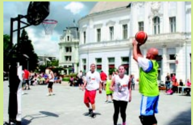
A streetball sorozat második állomása lesz Nyíregyháza