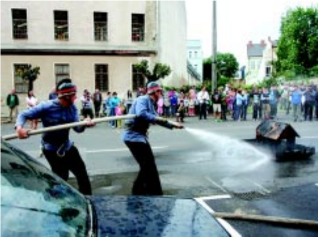
A Rendvédelmi napon az idén százharmincadik évfordulóját ünneplő Nyíregyházi Tűzoltóság is bemutatót tartott korhű ruhákban