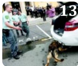
13 RENDVÉDELMI NAP

10 SIKERES ÉVAD A SZÍN- HÁZ MÖGÖTT. 14 új előadás, 4 ősbemutató, 426 előadás, 90 ezer néző. A Móricz Zsigmond Színház idei évadja számokban. A társulat eredményes évadot zárt.