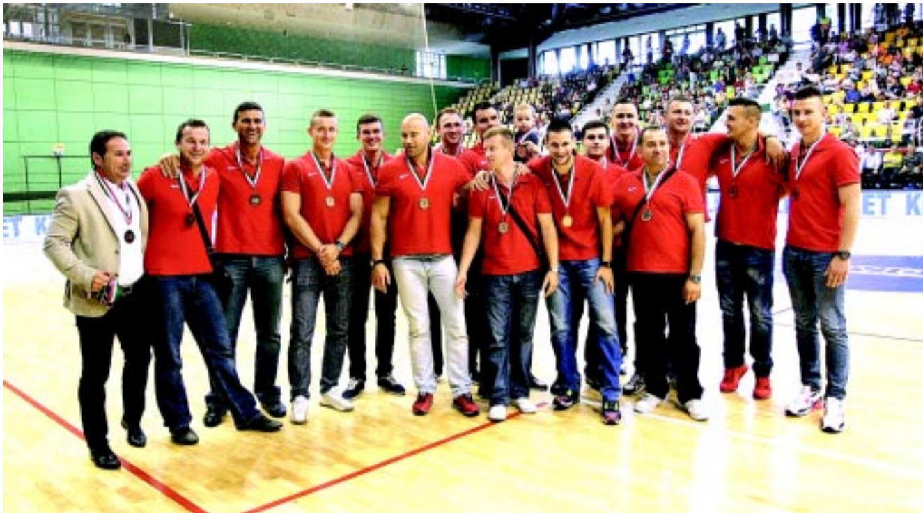
A magyar–román mérkőzés szünetében vehették át az érmeiket a játékosok

– A válogatott mérkőzés szünetében vehették át az érmeiket. Milyen érzés volt?