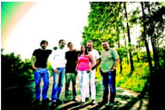
A Prémvadász zenekar

A Prémvadászok zenekar dalát választotta az Európai Tanács a gyűlöletbeszéd elleni mozgalmának kampánydalává. A szeretet mindenkié! Ez a mottója a számnak, amely pár hónapja már angolul is hallható a világhálón. A nyíregyházi zenekarra így méltán büszke lehet nemcsak Nyíregyháza, de egész Magyarország is.