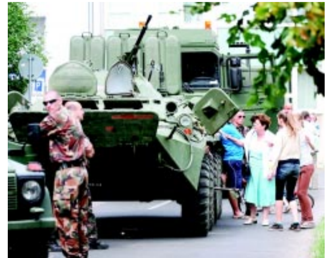
Ezen a napon szeretnék közelebb hozni a lakossághoz, a gyerekekhez a mindennapi munkájukat, bemutatni a felkészültségüket, a rendőrség barátságos arcát

Az ünnepélyes állománygyűlésen Nyíregyháza testvér-