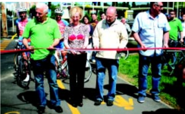
Az ünnepélyes szalagátvágás

A polgármester a sajtótájékoztatón arra is felhívta a figyelmet, hogy a közlekedésben a legfontosabb a biztonság. Ezért a mindennapokon arra kéri a kerékpárosokat, az autósokat és a gyalogosokat is, hogy figyeljenek a KRESZ szabályaira és egymásra. Dr. Kovács Ferenc a jövőt tekintve hangsúlyozta, a város kerékpárút-hálózatának fejlesztését a következő hétéves uniós költségvetési ciklusban is folytatni szeretnék. Már folynak a felmérések, hogy mely területeken lenne szükség a további építkezésre, akár a megyeszékhelyen kívül is, elsősorban Nagykálló és Tokaj irányába.