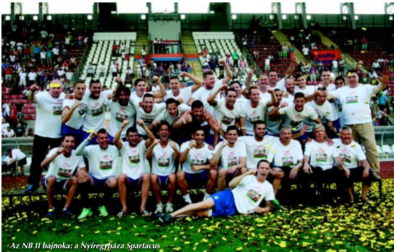
Az NB II bajnoka: a Nyíregyháza Spartacus