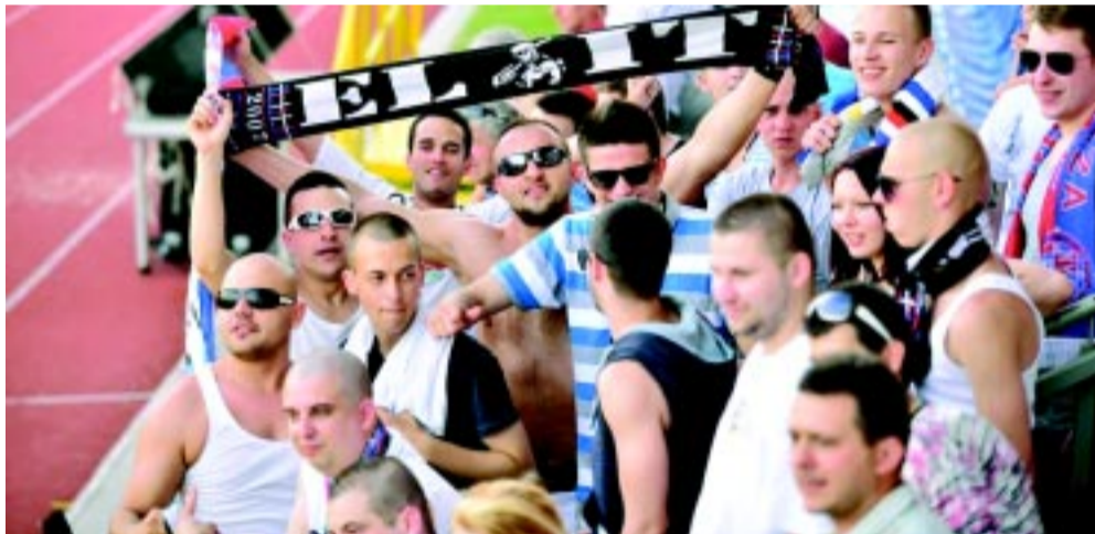
A szurkolói csoport neve arra is utal, hol a helye a Szparinak