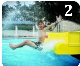
NYITNAK A STRANDOK

5 PATAK IS CSOBOG... Több mint 130 millió forintból újul meg a Tuzson János Botanikus Kert. A pályázati forrásból két éven keresztül végeztek természetvédelmi célú fejlesztéseket.