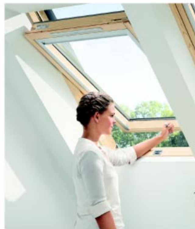
Alsó kilíncses Standard tetőtéri ablak (GZL B)