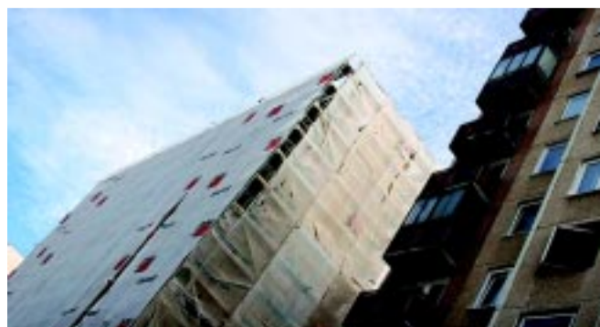
Az érkereti társasházak már szépülnek

– A Móra-beruházásnak elindult egy látványos eleme, az iskola tornatermének újjáépítése. Ez a fejlesztés már a jövőnek is szól, hiszen nemcsak állagmegóvás, hanem jelentős energetikai fejlesztés is megvalósulhat itt. Amikor felvetődött Örökösöld rehabilitációja, a közterek és az óvodák után rögtön az iskola fejlesztésének gondolata fogalmazódott meg. De már ekkor látszott, hogy abban a projektben nincs annyi forrás, hogy az iskola teljes egé-