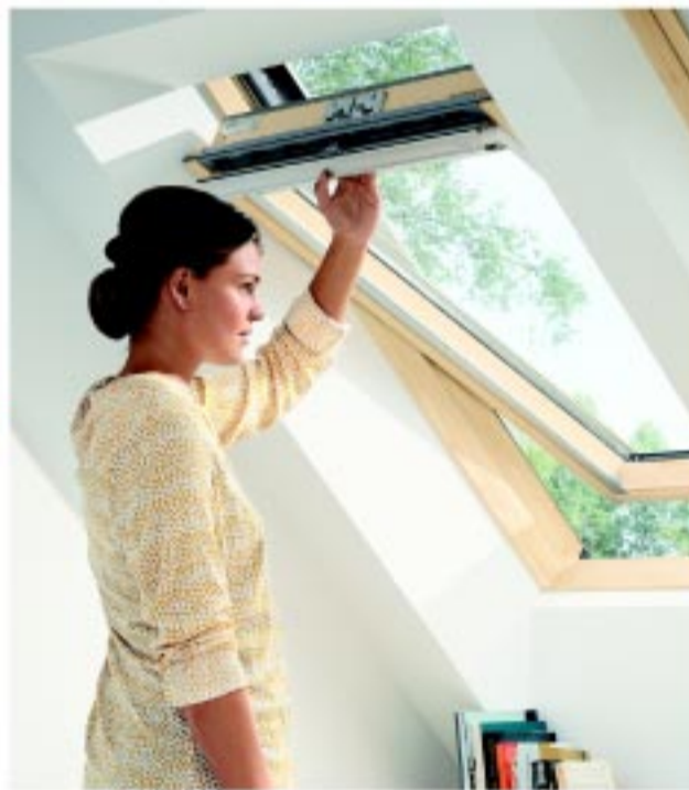
Felső kilíncses Standard Plus tetőtéri ablak (GLL)

A Standard Plus kategória tagja a GLL típus alsó kilíncses változata is, mely ugyanazokat az előnyöket nyújtja, mint a felső kilíncses megoldás. Szintén szellőztethető zárt állapotban kétfokozatú résszellőzővel, tartalmazza a ThermoTechnology™ hőszigetelési rendszert, az extra gumitömítést. Mind a felső, mind az alsó kilíncses GLL változat belső biztonsági üveggel kapható, mely azt jelenti, hogy a belső üvegréteg