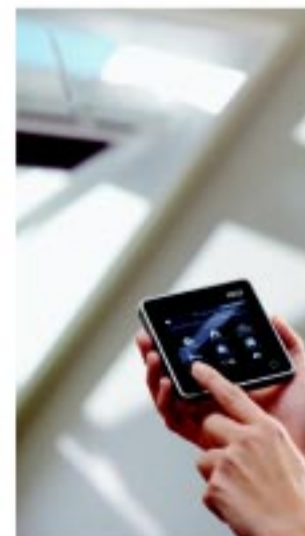
VELUX INTEGRA* érintőképernyős vezérlővel

4400 Nyíregyháza, Tünde utca 11. Telefon: +36-42-461-112 E-mail: info@colltrade.hu