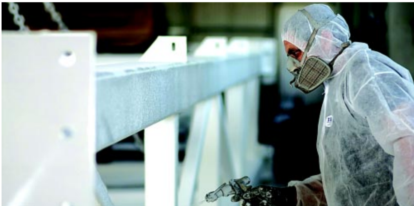
Védőréteget is kap a VMKK tetőszerkezete a Magyar Acélművek Kft.-nél szállítás előtt