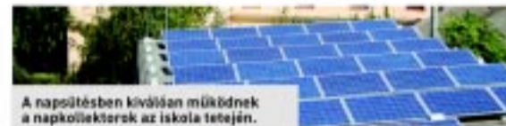
A napfényben kiválóan működnek a napkollektorok az iskola tetején.

Az Evangélikus Kossuth Lajos Gimnáziumban 2013 augusztusában a „KEOP-6.2.0/B/11-2011-0026 azonosítószámú pályázat keretében energetikai beruházásokat hajtottak végre. A projekt célja, a megújuló energiák hasznosítása mellett, a tanulók szemléletformáló nevelése volt, melynek keretében előadások, közösségi programok segítségével tanították meg a gyerekeknek, hogyan gazdálkodjanak környezetükkel. Ennek fontos eleme, hogy szemléltessék, a beruházásnak köszönhetően mennyi villamos energiával és folyóvízzel használtak kevesebbet a tanév folyamán. A mért adatokat monitorokon keresztül követhették a diákok. Eddig 167 m 3 vizet és 43740 KWh villamos energiát takarítottak meg. A mérési eredményeket bárki megtekintheti az iskola honlapján, a www.eklg.hu oldalon.