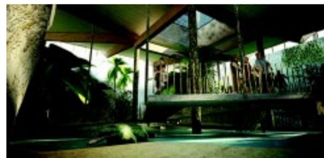
A Viktória-ház látványterve