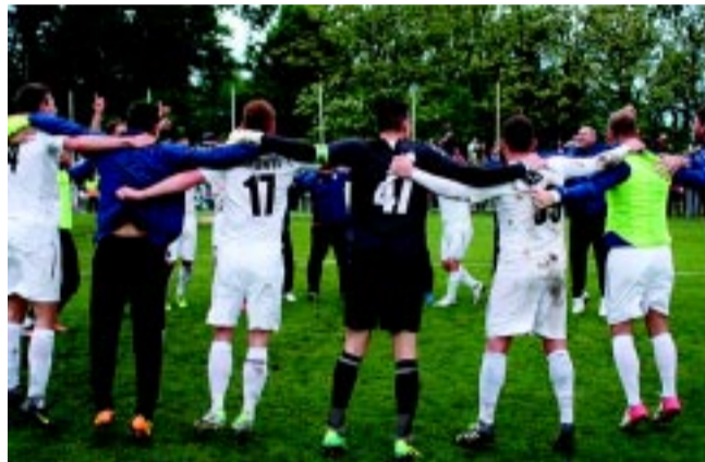
Körtánc Szpari módra