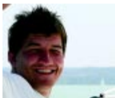
Matavovszky Dániel, Sportos és Egészséges Magyarországért Párt

A választások tétje most mindennél nagyobb! Itt az ideje annak, hogy újra méltó képviselők legyen Nyíregyházának a Parlamentben. Városunk polgárai mindig kiálltak a szabadság, a demokrácia, a szolidaritás értékei mellett. Tegye ezt meg újra Ön is, és menjen el szavazni! A szavazás titkos, és az a bizonyos 15 percnyi „fáradság” határozza majd meg az Ön és családja jövőjét is! Április 6. után a lehető legnagyobb felhatalmazással kívánom képviselni az Ön érdekeit és értékeit a magyar Parlamentben!