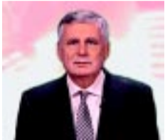
Balczó Zoltán, JOBBIK

Kedves olvasóink! A Város-Kép Kft. mindhárom médiumában folyamatosan, több ízben felhívást tett közzé az országgyűlési választásokon a Nyíregyházát érintő (I. és II.) választókerületekben induló hivatalos képviselőjelöltek számára, a különböző csatornákon való megjelenések kapcsán. Ezen az oldalon azok rövid bemutatkozását olvashatják választókerületenként, ABC-rendben, az esélyegyenlőségi szempontokat figyelembe véve azonos méretben, akik visszajeleztek szerkesztőségünknek.