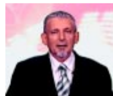
Tóth Miklós, LMP

Vissza kell adni az emberek jogait és szabadságát. Amíg a civil társadalom a dolgát végezte, addig az ország vezetése az elmúlt 24 évben nem látta el megfelelően a munkáját. Nem védtek meg az ország és az állampolgárok vagyont és érdekeit. Ebből az következett, hogy az ország elszegényedett, lakosainak jelentős része tönkrement. A jogérvényesítés is legtöbb esetben az állampolgárok kárára történik. Meg kell állítanunk ezt az áramot.