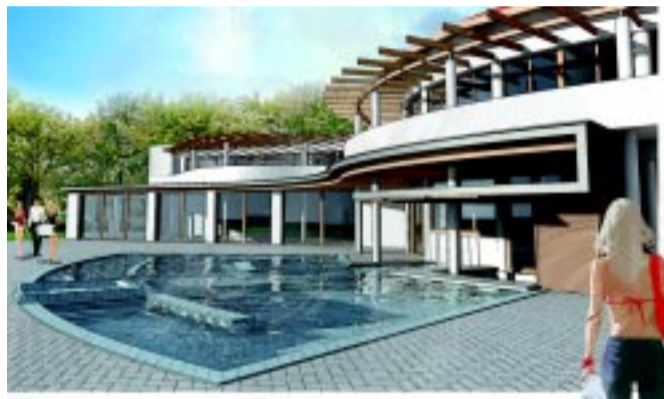
A fürdő bővül és megújul (látványterv)

A Nyíregyházán és környékén élők mindig is tudatában voltak annak, hogy milyen varázslatos hely Sóstógyógyfürdő. Sokan nagy előszeretettel keresték fel családi délutánok, pikniket, sportolást, vagy csak egy egyszerű séta kedvéért is. De lássuk be, Sóstóban ennél sokkal több van. Olyan turisztikai potenciál, mely nemcsak az üdülőterület, hanem a város gyarapodását is képes elősegíteni. A turisztikai attrakciók ismertsége külön-külön kevés, Sóstóval kapcsolatban komplexen kell gondolkodni. Ezt célozza meg a most induló beruházás, melyet dr. Kovács Ferenc polgármester mutatott be lapunknak.