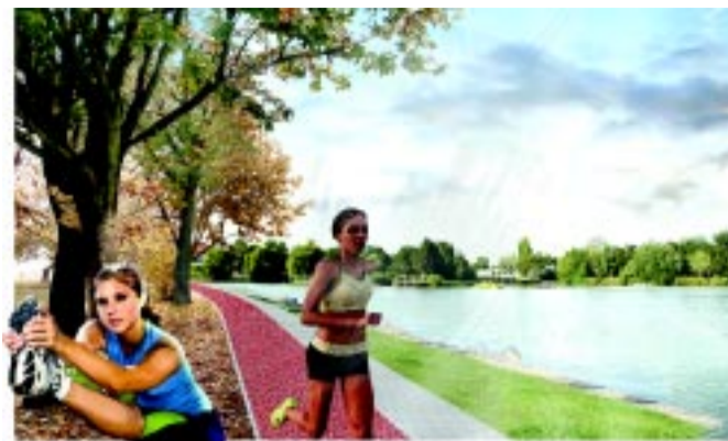
Így fest majd a tó környéke (látványterv)

Ha már van remek gyógyvíz, akkor fontos az egyedi gyógyászati profil kialakítása, így az Élmenyfürdő funkciója a gyógyvízre, gyógyellátásra hangsúlyt fektetve bővül. Az épület bővítésével komplex gyógyászati kezelőket alakítunk ki. A földszinten kap helyet a három medencéből álló váltófürdő és gyógyvízes medence, a Kneipp-medence. Az emeleti szinten lesznek a gyógyászati kezelők és az azokhoz tartozó vendégforgalmi terek, öltözők. Mobil fedést kap a Parkfürdő 50 méteres medencéje, mely télen is